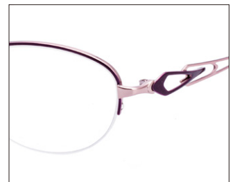
No.2 ワインパープル/ピンク

EP8003 材質F:チタンT:βチタン 52□16-140 ↓35.0 00250