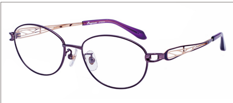
No.2 パープル/ゴールド (メッキ)

EP8004 材質F:チタンT:βチタン 52□16-140 ↓35.0 00250