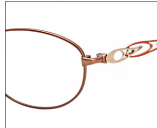
No.1 オレンジ/ゴールド (メッキ)