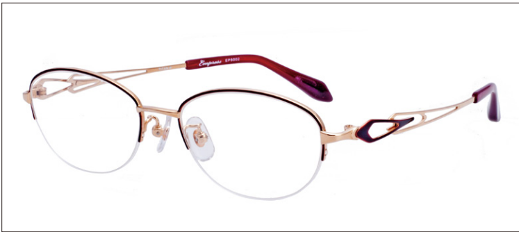
No.3 ワイン/ゴールド (メッキ)

EP8002 材質F:チタンT:βチタン 51□17-140 ↓35.0 00250