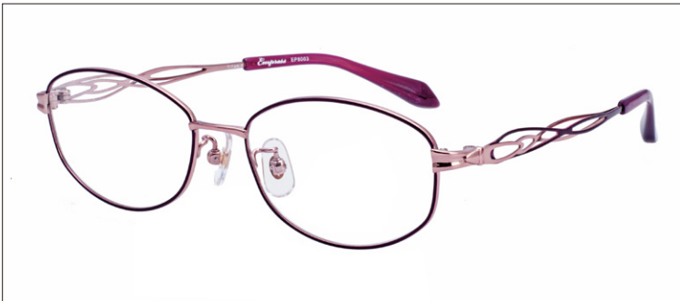
No.2 ワインパープル/ピンク

EP8003 材質F:チタンT:βチタン 52□16-140 ↓35.0 00250