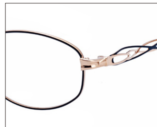
No.1 ネイビー/ゴールド (メッキ)