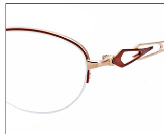
No.1 ライトブラウン/ゴールド(メッキ)