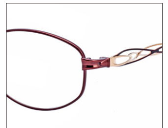
No.3 ワイン/ゴールド (メッキ)

EP8004 材質F:チタンT:βチタン 52□16-140 ↓35.0 00250