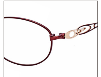
No.3 ワイン/ゴールド (メッキ)

EP8002 材質F:チタンT:βチタン 51□17-140 ↓35.0 00250