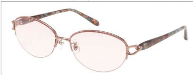
color1 F: オレンジ/ブラウンブルーササ L: フェアマロン (78%)

YK 3051 材質 T:合金 size:55□16-135 ↑39.2 00130