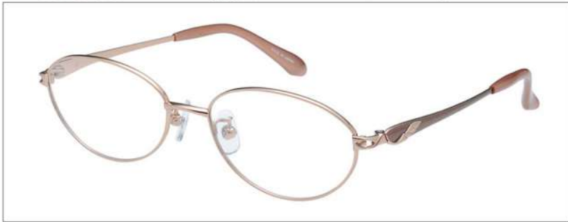
No.1 F:オレンジ T:ブラウン