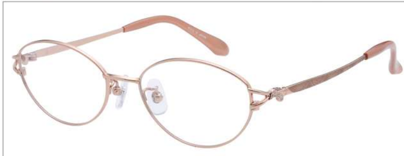
No.1 F: オレンジ T: ブラウンマット(印刷)