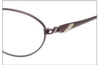
No.3 F:ワイン T:ワイン(ゴールドポイント)