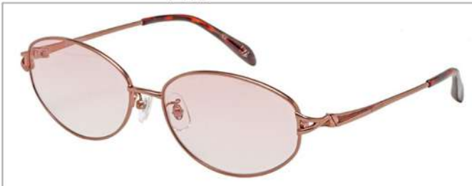
color1 F: オレンジ (ダークブラウンラメ) L: フェアマロン(78%)

YK 3048 材質 F:合金 T:合金 size:56□15-135 ↑38.5 00130