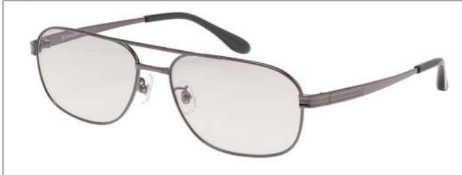
color3 F: ガンメタル L: ツールーグレー(52%)

YK 3513 材質 F:合金 T:合金 size:58□16-142 ↑41.2 00130