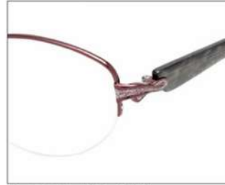
No.3 ワイン/ブラックササ

YK387 材質 F:チタン T:アセテート 52□17-135 ↑36.3 00230