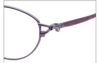
No.3 F: ワインパープル T: エンジェルマット(印刷)