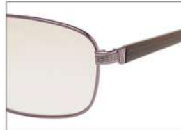
color2 F: ブラウン /カーキササ L: フェアブラウン (73%)

YK 3513 材質 F:合金 T:合金 size:58□16-142 ↑41.2 00130