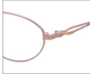
No.2 F:ピンク T:ピンクマット