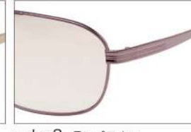
color3 F: ブラウン L: フェアブラウン (73%)

YK 3514 材質 F:合金 T:合金 size:55□17-142 ↑40.0 00130