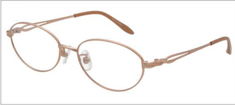
No.1 F:オレンジ T:オリーブマット