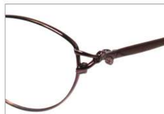
No.5 F: ワイン T: ワインマット(印刷)