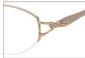
No.1 F: オレンジ T: ページュ