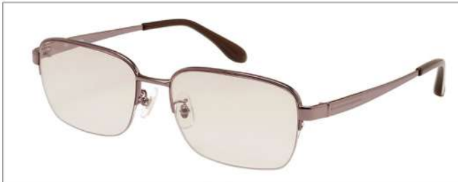
color2 F: ブラウン L: フェアブラウン(73%)

YK 3514 材質 F:合金 T:合金 size:55□17-142 ↑40.0 00130