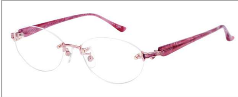
No.2 ピンク/ピンクササ

YK387 材質 F:チタン T:アセテート 52□17-135 ↑36.3 00230