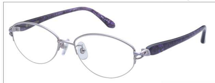
No.3 F: ラベンダー T: パープルササ