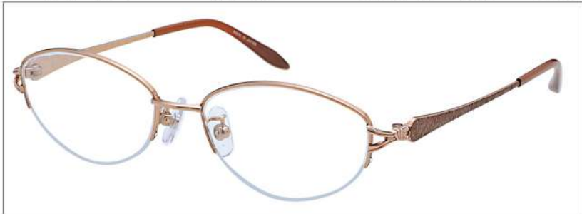
No.1 オレンジ (ブラウン)