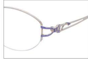
No.3 ホワイトゴールド

YK359 材質F:チタンT:βチタン 52□17-135 ↓37.1 00230