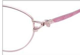
No.2 F: ピンク T: ピンクマット(印刷)