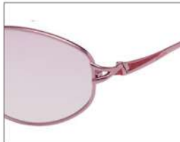
color2 F: ピンク (ダークワインラメ) L: ツールーパープル (78%)