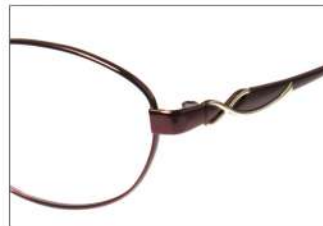
No.4 F:ワイン / ワイン