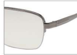
color1 F: ライトグレー L: ツールーグレー (52%)