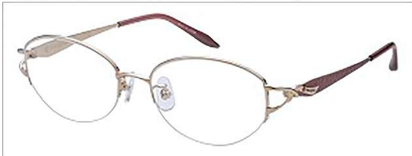
No.3 F: ホワイトゴールド T: ライラック