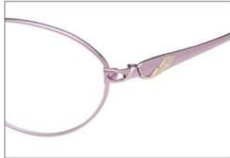
No.2 F:ローズピンク T:ローズピンク(ゴールドポイント)