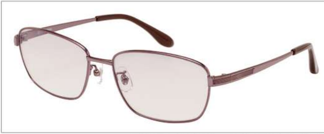
color2 F: ブラウン L: フェアブラウン(73%)

YK 3511 材質 F:合金 T:合金 size:56□16-142 ↑38.6 00130