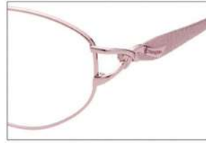
No.2 F: ピンク T: ピンクページュ