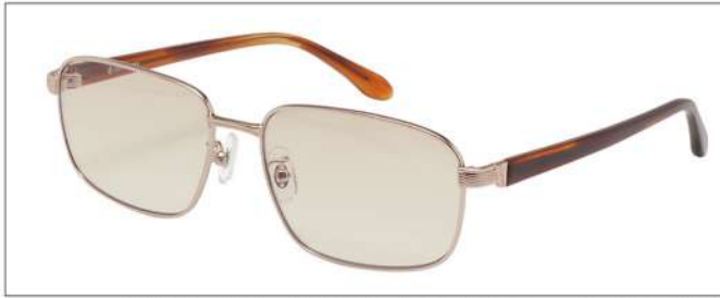
color1 F: ゴールド/ライトブラウンササ L: フェアブラウン(73%)

YK 3512 材質 F:合金 T:アセテート size:56□16-142 ↑39.0 00130