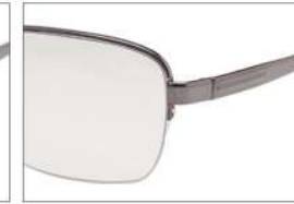
color3 F: ガンメタル L: ツールーグレー (52%)

YK 3048 材質 F:合金 T:合金 size:56□15-135 ↑38.5 00130