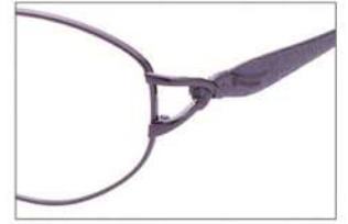
No.3 F: ワインパープル T: パープル