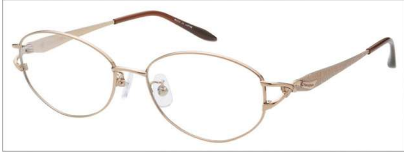
No.1 F: オレンジ T: ページュ