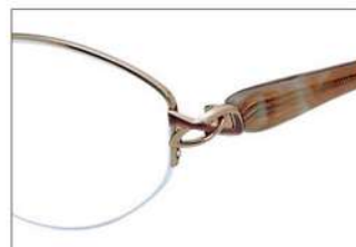
No.4 オレンジ / ブラウンササ