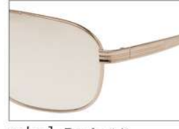
color1 F: ゴールド L: フェアブラウン (73%)