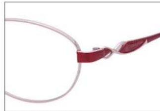
No.2 ピンク / ワイン