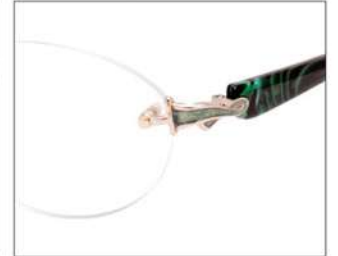
No.3 ライトゴールド/グリーンブロック