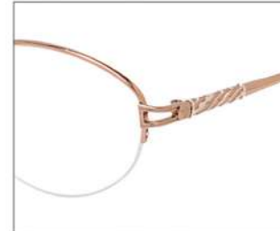
No.1 オレンジゴールド