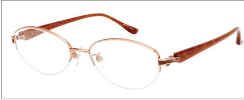
No.1 オレンジゴールド/ブラウンササ

YK386 材質 F:チタン T:アセテート 52□17-135 ↑35.5 00230