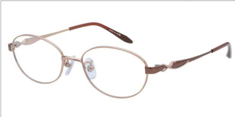
No.1 オレンジ / ブラウン