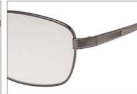
color3 F: ガンメタル L: ツールーグレー (52%)

YK 3512 材質 F:合金 T:アセテート size:56□16-142 ↑39.0 00130