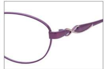
No.3 パープル / パープル (ゴールドポイント)