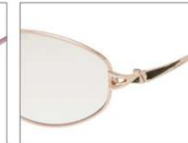
color3 F: ライトゴールド (ダークグリーンラメ) L: グロウブルーム (77%)

YK 3051 材質 T:合金 size:55□16-135 ↑39.2 00130