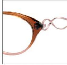
No.2 F:クリアブラウン ピンクハーフ T:ピンク /クリアブラウン