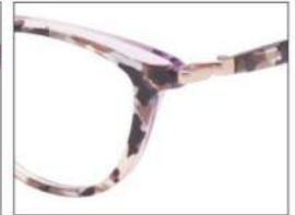
No.4 カーキブロック ×クリアライトパープル