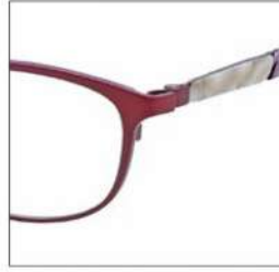
No.3 F:ワイン(ピンクパープル) T:アイボリーブロック / ラベンダーブロック