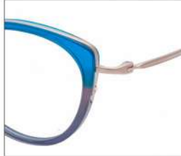
No.2 F:ゴールド×アクアブルー/グレーグラデ T:ゴールド