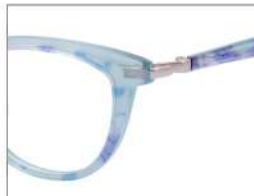
No.6 アクアブルーラメ