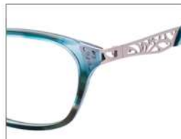
No.5 グリーンブラウンデミ (ピンクゴールド)