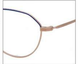
No.3 F:ゴールド×ネイビー T:ゴールド

MX 5024 材質 F:アセテート×チタン T:βチタン 49□20-137 141.0 00340