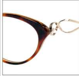
No.1 F:レオパード ブラウンデミ T:ゴールド/レオパード ブラウンデミ