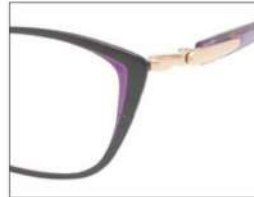
No.2 F:ブラック(パープル) T:パールパープルブロック