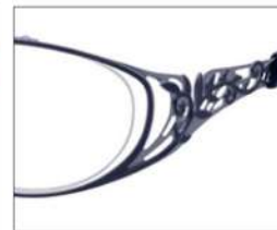
No.4 F:ネイビー/ライトブルー T:パールネイビー