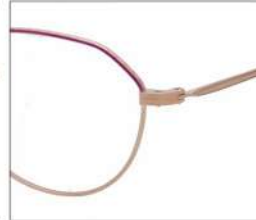
No.2 F:ゴールド× レッドパープル T:ゴールド