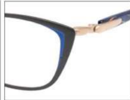
No.1 F:ブラック(ブルー) T:パールブルーブロック