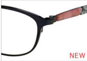
No.5 F:バイレットパール T:ラベンダーササ/グレーササ