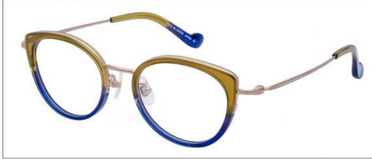
No.1 F:ゴールド×カーキ/ネイビーグラデ T:ゴールド

材質 F:アセテート×チタン T:βチタン 48□20-137 ↓39.5 00340