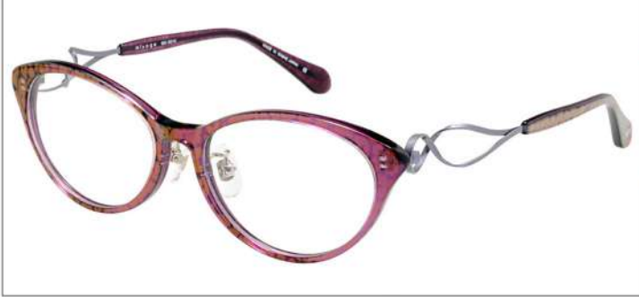
No.3 F:レオパードクリアパープル T:ラベンダー/レオパードクリアパープル

材質 F:アセテート T:βチタンアセテート 52□16-140 ↓37.0 00320