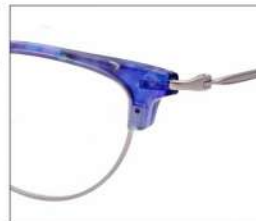
No.3 F:シルバー×ライトブルー パープルデミ T:シルバー