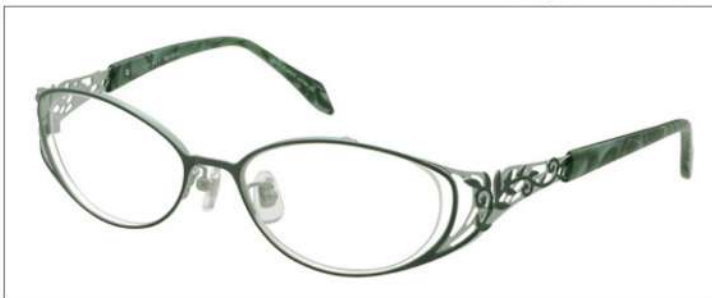
No.1 F:グリーン/ライトグリーン T:グリーンブロック

MX 5012 材質 F:ステンレス T:ステンレス/アセテート 51□17-133 ↓32.5 00320