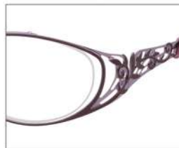
No.3 F:ワイン/ライトピンク T:ワインブロック