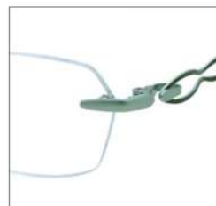
No.4 F:ライトグリーン T:カーキグリーン

MX 5003 材質 F:アセテート T:βチタン パネ部:βチタン 52□15-137 ↓32.3 00330