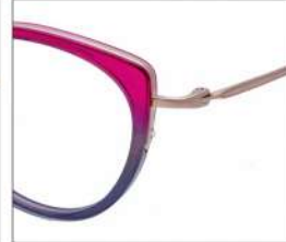
No.3 F:ゴールド×ピンク/グレーグラデ T:ゴールド