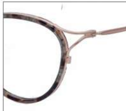
No.1 F:ゴールド× グレーブラウンデミ T:ゴールド