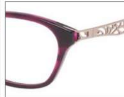
No.2 F:パープルササ T:パープルササ (ピンクゴールド)