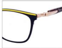
No.5 F:ブラック(イエロー) T:グリーンラメ