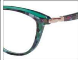
No.1 パープルブロック ×クリアダークグリーン