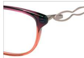
No.6 F:パープルピンクハーフ T:ピンク

MX 5004 材質 F:チタン T:βチタン アセテート パネ部:βチタン 53□16-130 ↓34.0 00330