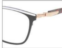
No.3 F:ブラック(ホワイト) T:ブラウン×グレー