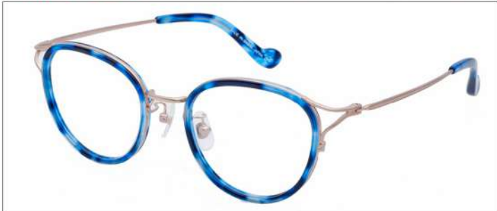
No.4 F:ゴールド×ブルーネイビーデミ T:ゴールド

MX 5024 材質 F:アセテート×チタン T:βチタン 49□20-137 141.0 00340