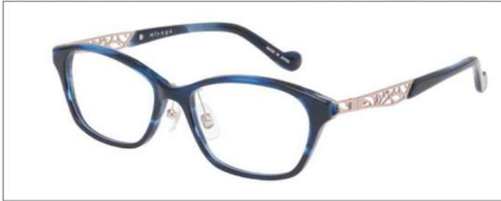
No.4 F:ネイビーササ T:ネイビーササ(ピンクゴールド)