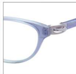
No.3 F:パールブルー グリーンハーフ T:シルバー