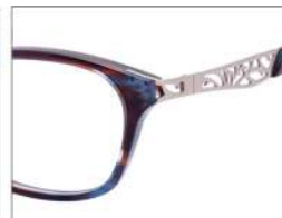
No.6 ブラウンブルーデミ (ピンクゴールド)