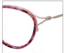
No.3 F:ゴールド×レッドパープル ブラウンデミ T:ゴールド

MX 5025 材質 F:アセテート×チタン T:βチタン 52□18-137 136.5 00340