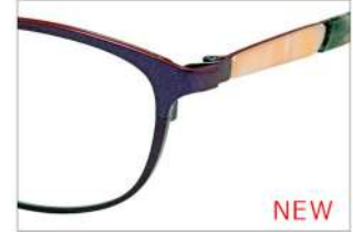
No.6 F:エモーショナルレッドパール T:パープルピンクササ/ベージュササ