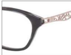
No.1 F:グレーササ T:グレーササ (ピンクゴールド)