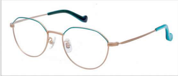
No.4 F:ゴールド×ピーコックブルー T:ゴールド

MX 5023 材質 F:チタン×七宝 T:βチタン 51□18-137 141.0 00320