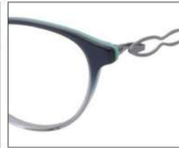
No.3 F:パールブルーハーフ ミントグリーン T:ライトブルー