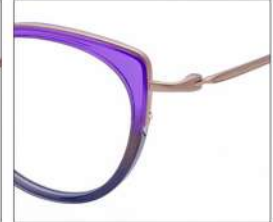
No.4 F:ゴールド×パープル/グレーグラデ T:ゴールド