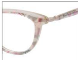
No.5 オフホワイトラメ