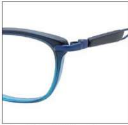
No.4 F:アクアハーフ T:ブラックブロック / ブルー