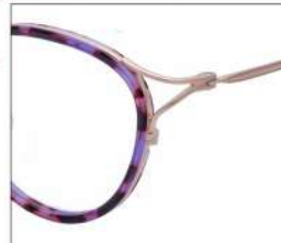
No.2 F:ゴールド×パープル ブラウンデミ T:ゴールド