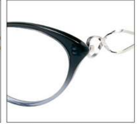
No.4 F:クリアグレーハーフ T:シルバー /クリアグレー