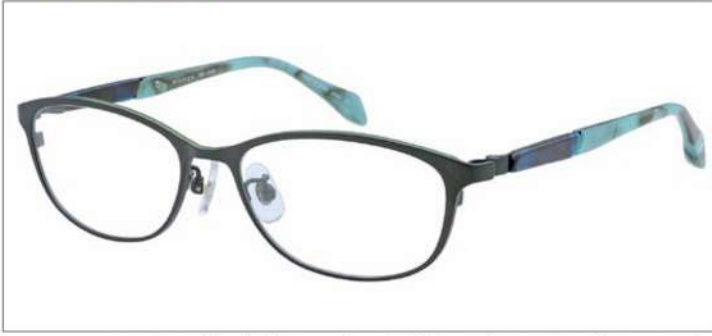
No.1 F:ダークグリーン(ライムグリーン) T:アクアグリーンササ / ライトグリーンブロック

材質 F:チタン T:βチタンアセテート バネ部:βチタン 53□16-130 ↓32.1 00350