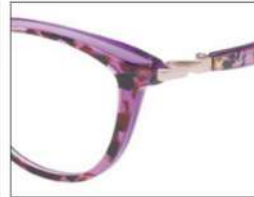
No.2 ブラウンブロック ×クリアパープル