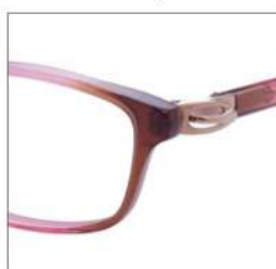
No.3 F:ピンクブラウングラデ T:ゴールド