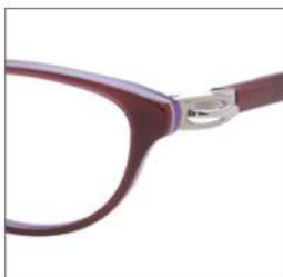
No.1 F:ワイン/パープル T:シルバー