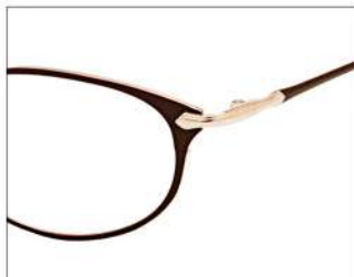
No.2 F:ダークブラウン T:ダークブラウン (ライトゴールド)