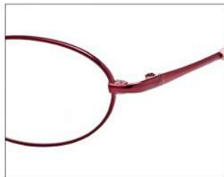
No.3 F:ワイン T:ピンク