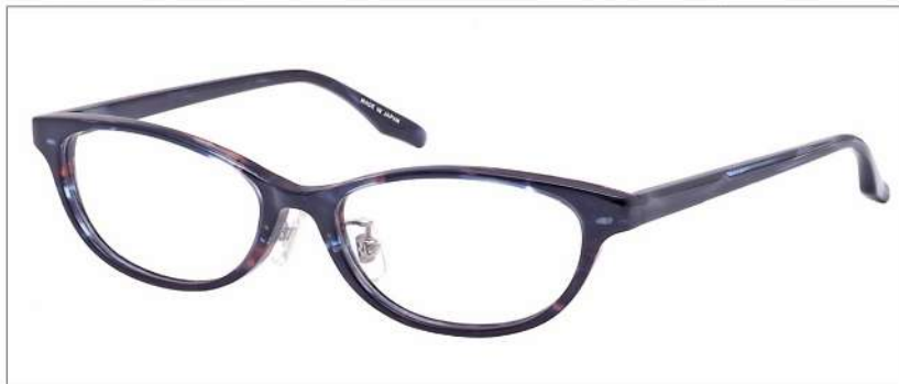
No.1 F: ネイビーパープルササ