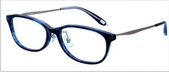
No.1 F:ネイビーササ T:ライトグレーマツト

NB6011 材質 F:アセテート T:βチタン 52□16-140 ↓33.0 00250