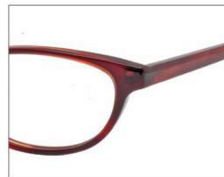
No.3 ワインピンクササ