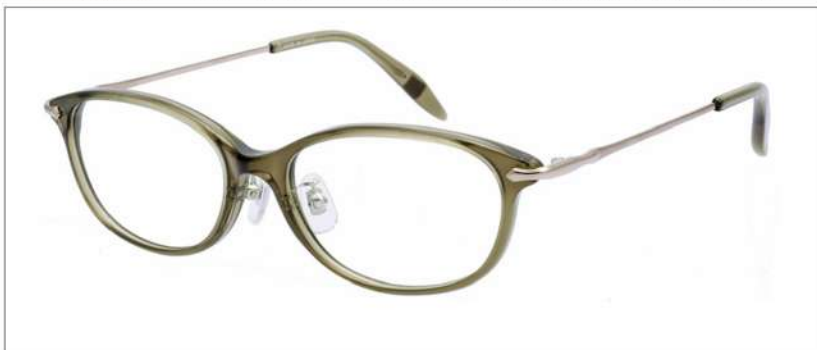
No.1 クリアカーキ/ライトゴールド

NB 6028 材質 F:アセテート T:βチタン 52□16-138 133.5 00240