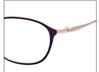
No.2 ブラウン/ゴールド