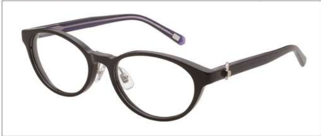
No.1 F:ブラック T:ネイビー/クリアパープル