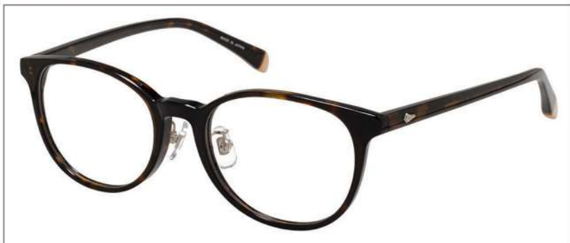
No.2 F: ブラウンデミ T:ブラウンデミ(ベージュ)