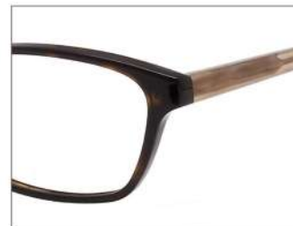
No.2 F: ブラウンデミ T: ベージュ

NB 6028 材質 F:アセテート T:βチタン 52□16-138 133.5 00240