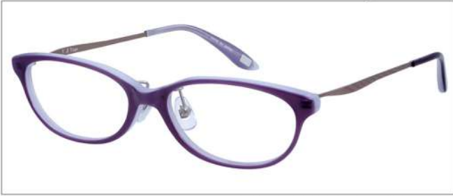
No.1 F:パープル/ホワイト T:ライトグレーマツト

NB6010 材質 F:アセテート T:βチタン 51□16-135 ↓30.0 00250