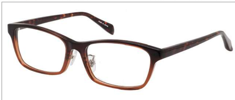
No.3 F: クリアブラウンハーフ T: ブラウンデミ