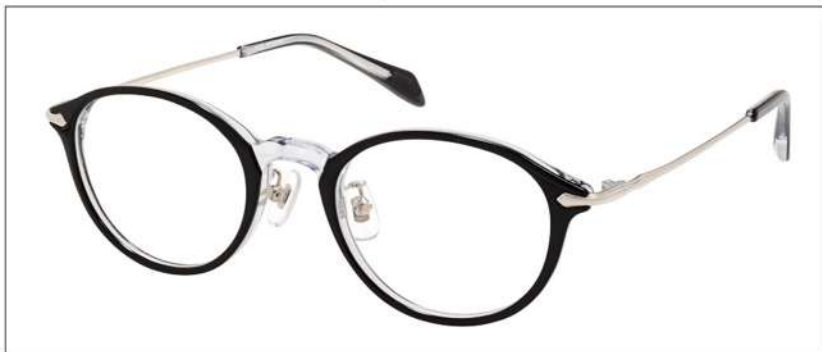
No.1 F:ブラック/クリア T:シルバー

NB 6020 材質 F:アセテート T:βチタン 48□21-138 ↓38.5 00240