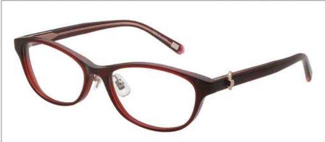
No.3 F:ワイン T:ワインパープル/ワインラメ