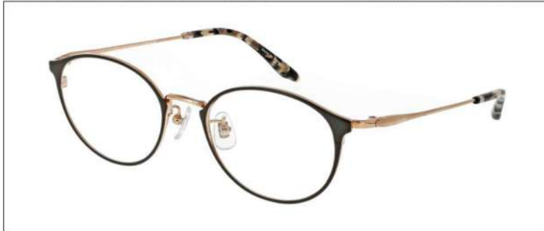
No.1 チャコール/ゴールド

NB 6032 材質 F:チタン T:βチタン 49□19-138 高さ39.0 00240