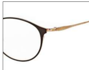
No.2 ブラウン/シルバー