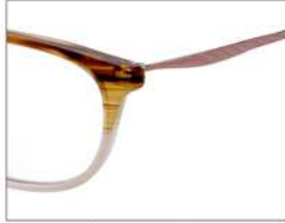
No.3 F:ブラウンササピンクハーフ T:ピンク