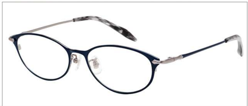
No.1 F:ネイビー T:ネイビー(グレー)

NB 6022 材質 F:チタン T:βチタン 52□16-138 ↓32.9 00240