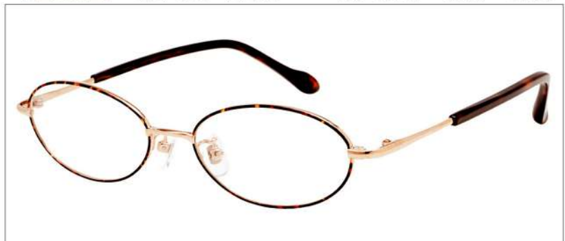
No.1 F: ライトゴールド(ブラウン七宝) T:ブラウンデミ

NB 6023 材質 F:チタン T:βチタン 51□16-140 ↓30.0 00230