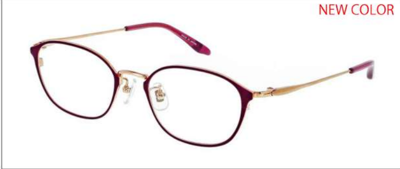
No.4 パープル/ゴールド