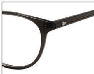
No.1 F:ダーククリアグレー T:ダーククリアグレー (アクアブルー)