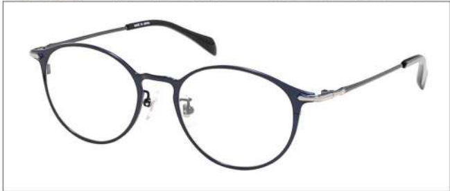
No.1 F:ネイビー T:ネイビー(ライトグレー)

NB6017 材質 F:チタン T:βチタン 50□18-138 ↓39.8 00240