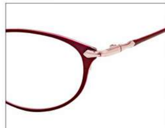
No.3 F:ワイン T:ワイン(ライトピンク)

NB 6023 材質 F:チタン T:βチタン 51□16-140 ↓30.0 00230