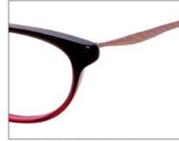
No.3 F:ダークワインハーフ T:ピンク

NB6011 材質 F:アセテート T:βチタン 52□16-140 ↓33.0 00250