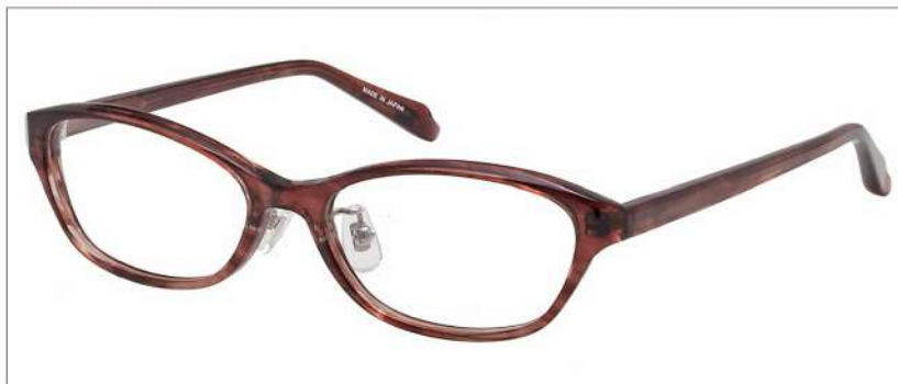
No.3 パープルブラウンササ