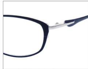
No.1 ネイビー/シルバー