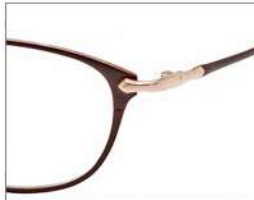
No.5 ブラウン/ライトゴールド