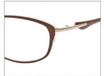
No.2 カフェブラウン/ゴールド

NB 6031 材質F:アセテートT:βチタン 50□16-138 ↓ 31.7 00240