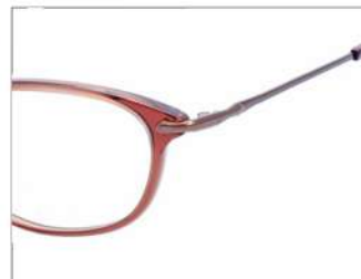
No.3 クリアピンクベージュ / ピンクゴールド