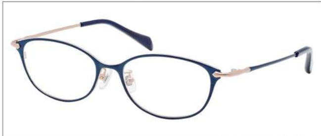
No.4 ネイビー/マツトゴールド

NB6016 材質 F:チタン T:βチタン 52□16-138 ↓33.5 00240