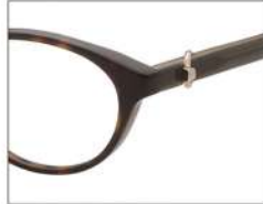
No.2 F:ブラウンデミ T:カーキ/カーキベージュ

NB6016 材質 F:チタン T:βチタン 52□16-138 ↓33.5 00240