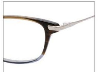
No.3 ブラウンブルーハーフ/ゴールド