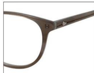
No.3 F:ブラウングレーササ T:ブラウングレーササ (クリアグレー)

NB 6022 材質 F:チタン T:βチタン 52□16-138 ↓32.9 00240