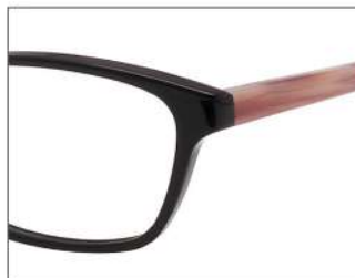
No.1 F: ブラック T: ピンクデミ