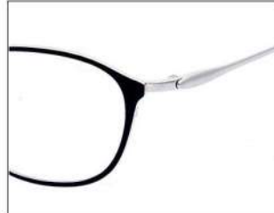
No.1 ブラック/シルバー