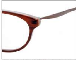
No.2 F:ブラウンササピンクベージュ T:カフェ