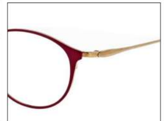
No.3 バーガンディ/ゴールド