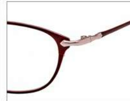
No.6 ワイン/ライトピンク

NB6017 材質 F:チタン T:βチタン 50□18-138 ↓39.8 00240