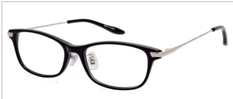
No.1 ブラック/ゴールド

NB 6031 材質F:アセテートT:βチタン 50□16-138 ↓ 31.7 00240