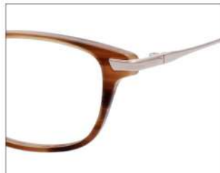
No.2 ブラウンササ/ゴールド