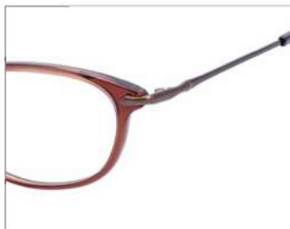
No.2 クリアブラウン / ブラウンゴールド