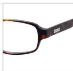
No.2 ダークブラウンデミ