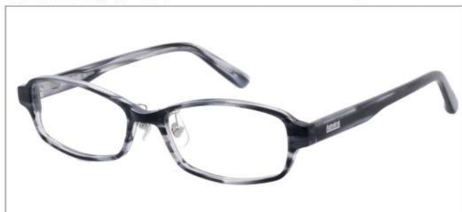
No.3 ダークグレーササ