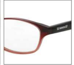
No.3 F:ダークワインハーフ T:ブラック