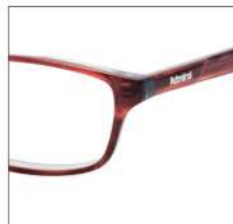
No.2 ブラウングリーンササ