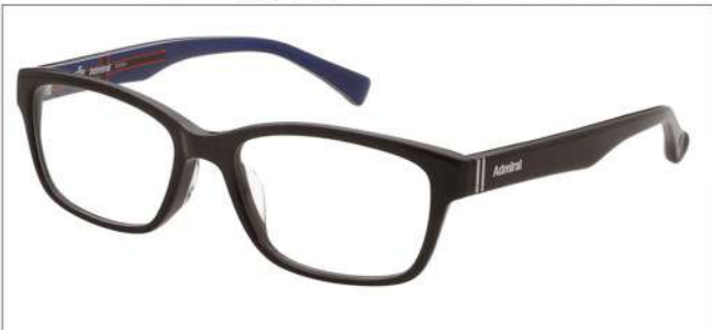
No.5 ブラック (ブラック/ネイビー)