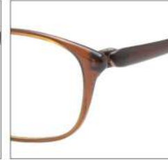
No.2 F:ライトブラウン T:ブラウン /IPマットゴールド