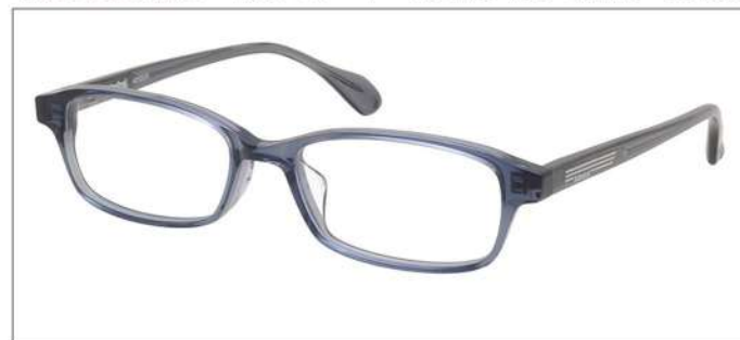
No.3 F:クリアブルーグレー T:ダーククリアグレー