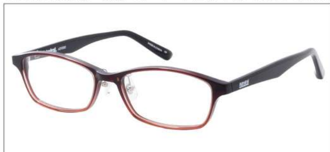
No.4 F:ダークワインハーフ T:ブラック