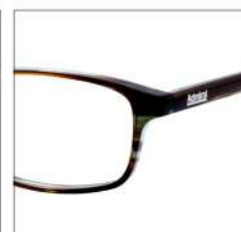
No.4 ミントブラウンササ