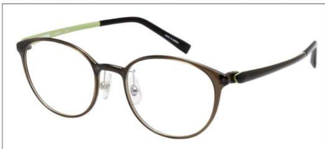
No.4 F:カーキ T:カーキ/スモークライトグリーン