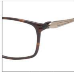
No.3 F:ブラウンデミ T:IPマットゴールド