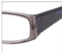
No.3 F:グレー T:ブルーササ