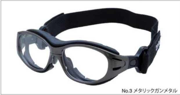
No.3 メタリックガンメタル