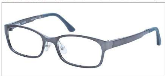
No.3 シャーリンググレー

AD 2044 材質 F:ウルテム T:ウルテム 52□17-140 ↓32.0 00150