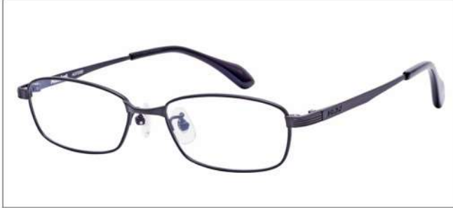
No.3 マットガンメタル