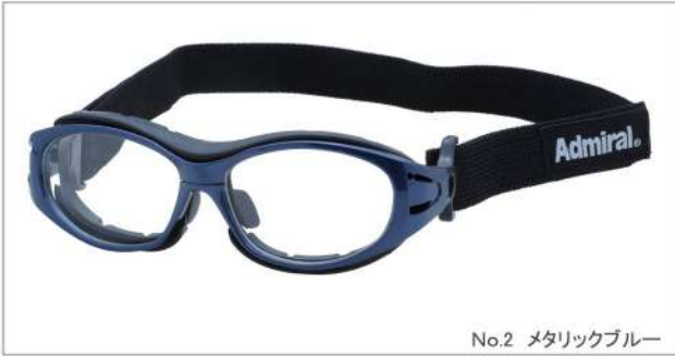
No.2 メタリックブルー