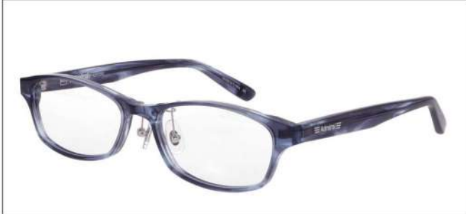
No.4 ブルーグレーササ