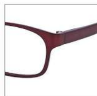
No.4 シャーリングワイン