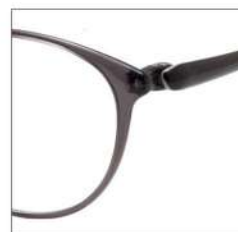
No.1 F:カーキグレー T:グレー/スモークグレー