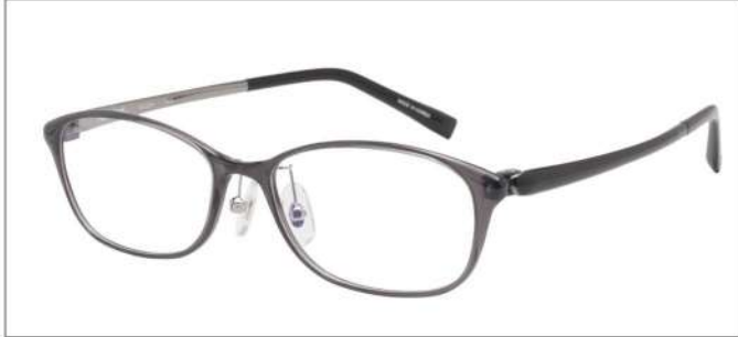
No.4 F:クールグレー T:クールグレー/IPライトグレー