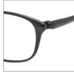
No.1 F:ブラック T:ブラック /IPダークレッド