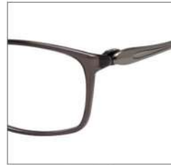
No.4 F:カーキグレー T:IPマットライトグレー