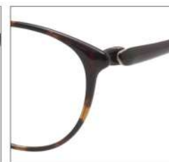
No.2 F:ブラウンデミ T:ブラウン/ページュ