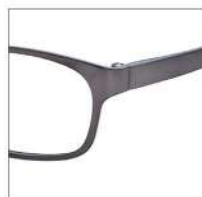
No.2 シャーリングブラウン