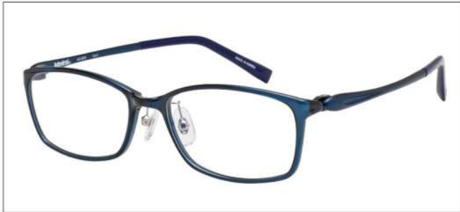
No.2 F:ブルー T:IPマットブルー