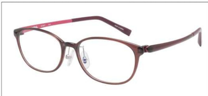
No.3 F:ブラウングレー T:レッドブラウン/ローズ