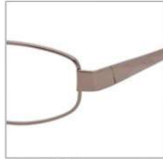
No.2 ブラウン (ライム/ブラック)