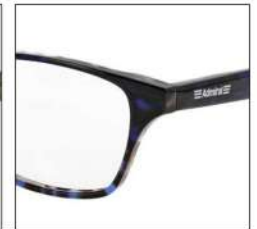
No.4 ブルーグレーデミ