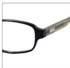
No.1 F:ブラック T:カーキ