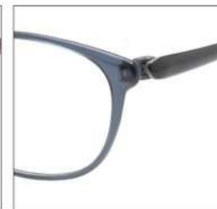
No.4 F:ブルーグレー T:ブルーグレー /オリーブグレー