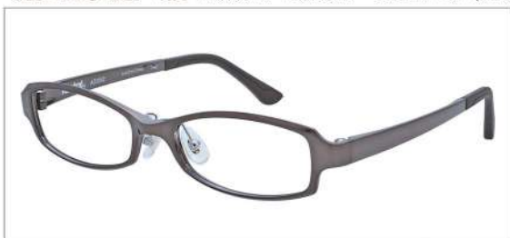
No.2 シャーリングブラウン

AD 2042 材質 F:ウルテム T:ウルテム 53□17-140 ↓27.2 00150