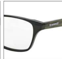
No.3 F:ブラック T:カーキ