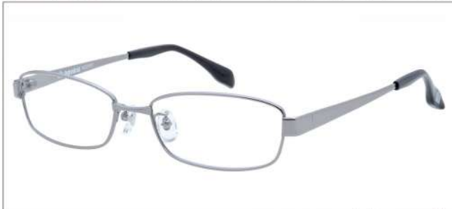
No.1 シルバー (ブルー/レッド)