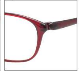
No.3 F:ダークレッド T:ダークレッド /IPマットグレー