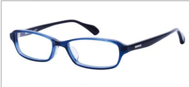
No.4 ネイビー/ブラック