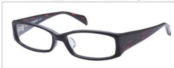
No.4 F:ブラック T:レッドササ