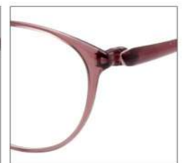
No.3 F:グレイッシュピンク T:グレイッシュピンク /ピンク