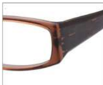
No.2 F:ブラウン T:ブラウンササ