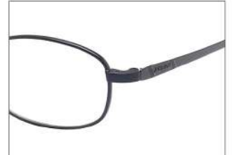
No.3 ブラックパープルマット