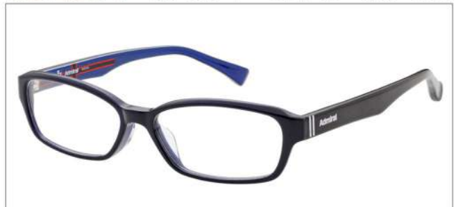
No.5 ネイビー(ブラック/ネイビー)