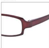
No.4 シャーリングワイン

AD 2044 材質 F:ウルテム T:ウルテム 52□17-140 ↓32.0 00150