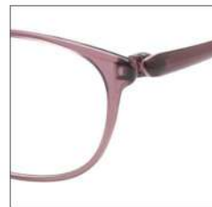
No.2 F:グレイッシュピンク T:グレイッシュピンク /スモークピンク