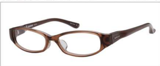
No.2 ブラウン/ダークブラウン

AD 2034 材質 F:アセテート T:TR90 51□15-138 ↓26.5