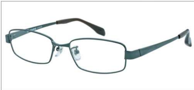
No.2 グリーンブラック(グリーン/ホワイト)