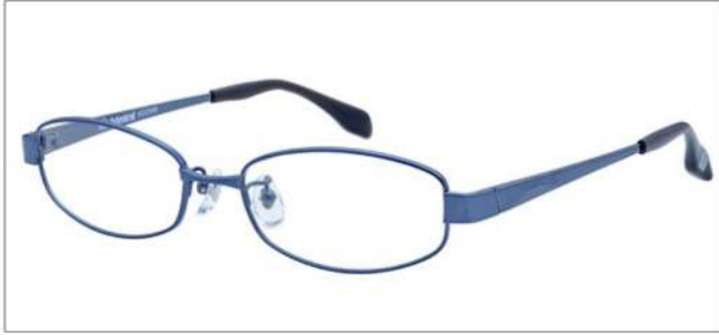
No.1 ブルー (イエロー/ブラック)