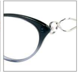
No.4 F:クリアグレーハーフ T:シルバー /クリアグレー

MX5015 材質 F:チタン T:アセテート(バネ部:βチタン) 52□16-135 †37.0 00340