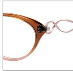
No.2 F:クリアブラウン ピンクハーフ T:ピンク /クリアブラウン