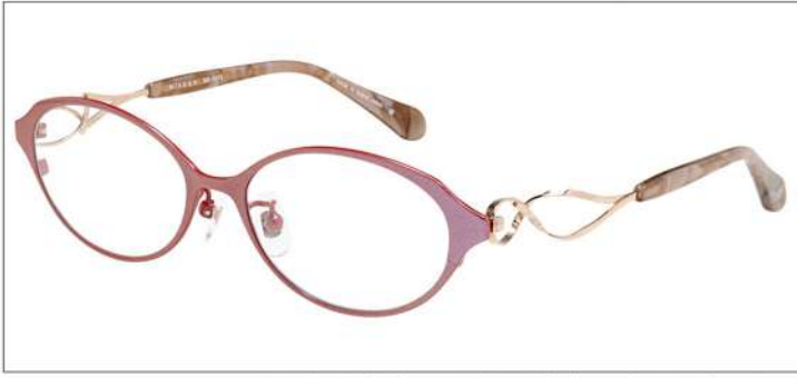
No.2 F:ピンク No.2 F:ピンク ゴールドブロック

MX5013 材質 F:チタン T:βチタンアセテート 52□16-140 †34.0 00320