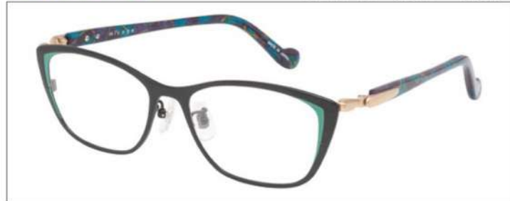
No.4 F:ブラック(グリーン) T:パールグリーンブロック

MX5016 材質 F:チタン T:アセテート(バネ部:βチタン) 52□16-135 †36.0 00340