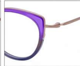
No.4 F:ゴールド×パープル/グレーグラデ T:ゴールド