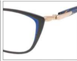
No.1 F:ブラック(ブルー) T:パールブルーブロック