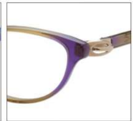
No.4 F:ブラウン パープルグラデ T:ゴールド