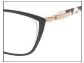
No.3 F:ブラック(ホワイト) T:パールホワイトブロック