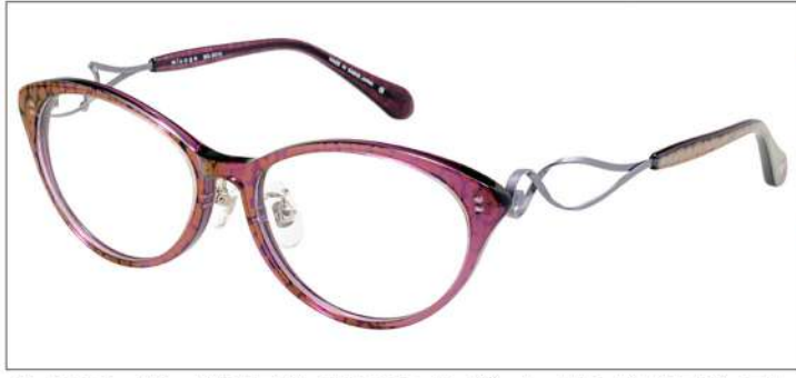
No.3 F:レオパードクリアパープル T:ラベンダー/レオパードクリアパープル

MX5014 材質 F:アセテート T:βチタンアセテート 52□16-140 †37.0 00320