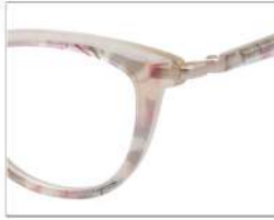
No.5 F:オフホワイトラメ