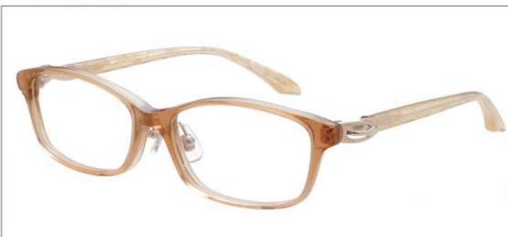
No.2 F:パールベージュピンク T:シルバー