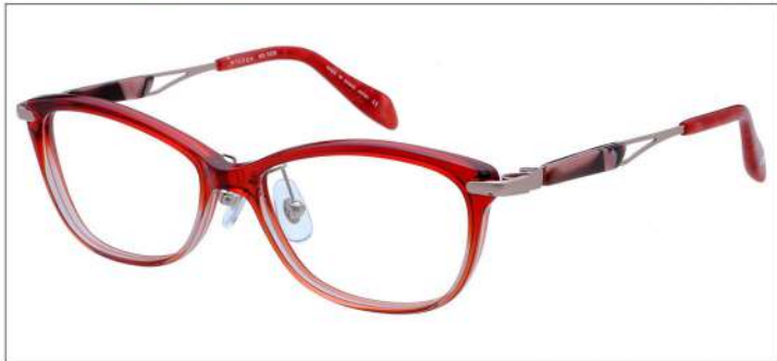
No.1 F:レッドハーフ T:ピンクブロック / ピンク

材質 F:アセテート T:βチタン パネ部:βチタン 52□15-130 ↓34.2 00350