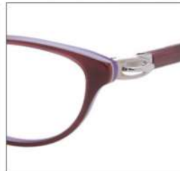
No.1 F:ワイン/パープル T:シルバー