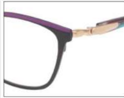
No.2 F:ブラック(パープル) T:パープルxグリーン