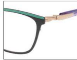
No.4 F:ブラック(グリーン) T:パープルxグレー