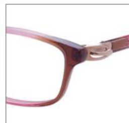
No.3 F:ピンクブラウングラデ T:ゴールド