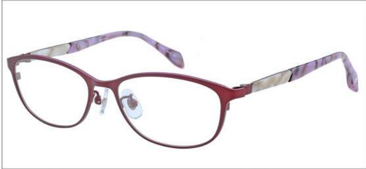
No.3 F:ワイン(ピンクパール) T:アイボリーブロック / ラベンダーブロック

材質 F:チタン T:βチタンアセテート パネ部:βチタン 53□16-130 ↓32.1 00350