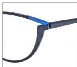
No.3 F:ブラック×ライトブルー T:ブラック