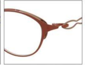
No.4 F:オレンジブラウンマット/ ゴールド T:ゴールド