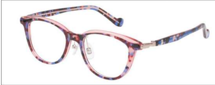
No.3 ブルーブロック×クリアピンク

材質 F:アセテート T:アセテート(パネ部:βチタン) 48□18-135 ↓37.0 00320