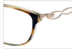
No.5 F:ブラウンデミ/ホーン/クリ T:ゴールド

MX 5004 材質 F:チタン T:βチタン アセテート パネ部:βチタン 53□16-130 ↓34.0 00330