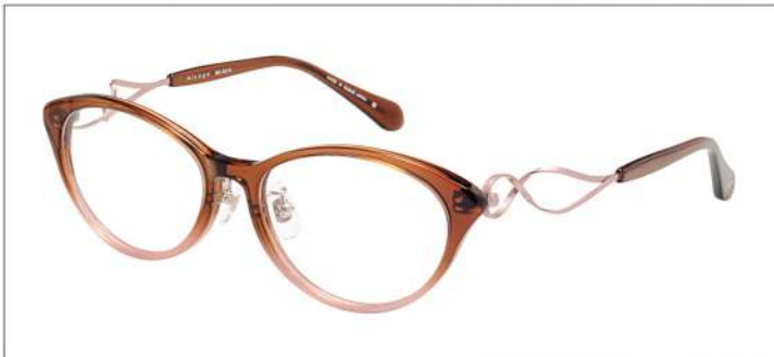
No.2 F:クリアブラウンピンクハーフ T:ピンク/クリアブラウン