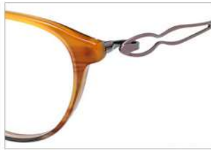
No.5 F:ブラウンパープルハーフ T:ローズ