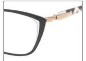
No.3 F:ブラック(ホワイト) T:パールホワイトブロック