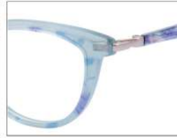
No.6 F:アクアブルーラメ