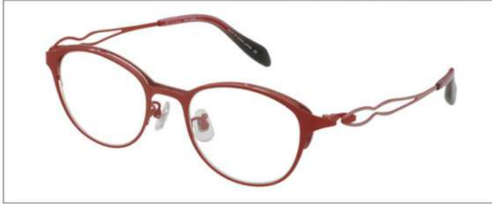
No.3 F:レッドマット/ピンク T:ピンク