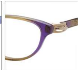
No.4 F:ブラウン パープルグラデ T:ゴールド