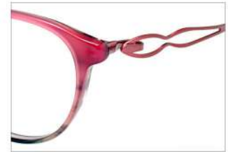
No.6 F:カーキピンクグレーハーフ T:チェリー