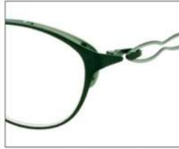
No.1 F:グリーンマット/ ライトグリーン T:ライトグリーン