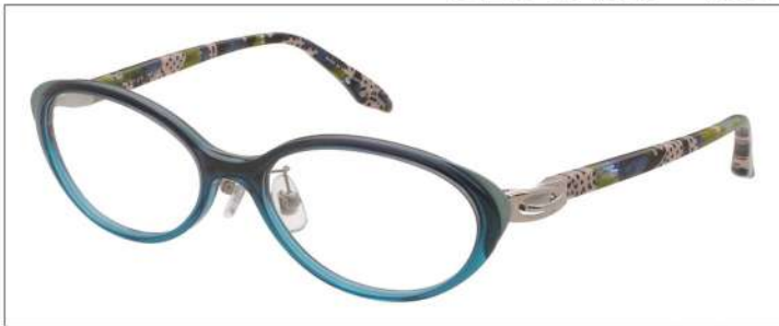
No.1 F:アクアグラデ/ミントグリーン T:アクア、ベージュブロック