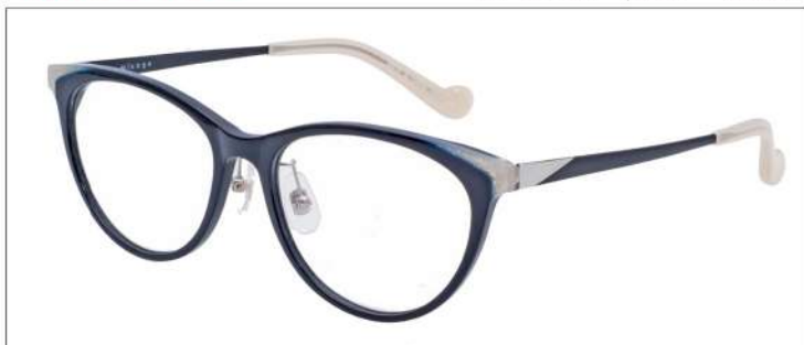
No.3 F:ブラック×ホワイトラメ T:ブラック

材質 F:アセテート T:βチタン×七宝 52□16-137 ↓39.5 00340