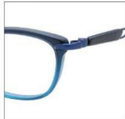
No.4 F:アクアハーフ T:ブラックブロック / ブルー