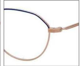
No.3 F:ゴールド×ネイビー T:ゴールド