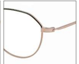
No.7 F:ゴールド×ブラック T:ゴールド

MX 5026 材質F:チタン×七宝 T:βチタン 54□18-137 ¥43.1 00320