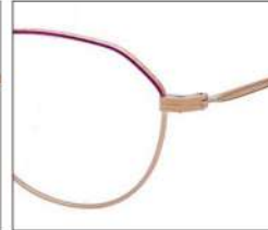
No.2 F:ゴールド× レッドパープル T:ゴールド