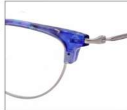
No.3 F:シルバー×ライトブルー パープルデミ T:シルバー