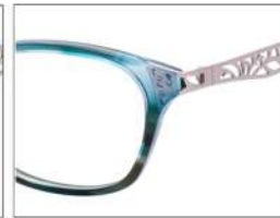
No.5 F:グリーンブラウンデミ (ピンクゴールド)