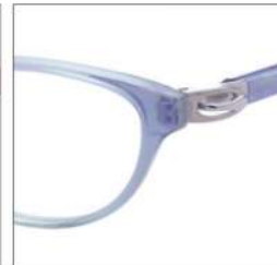
No.3 F:パールブルー グリーンハーフ T:シルバー