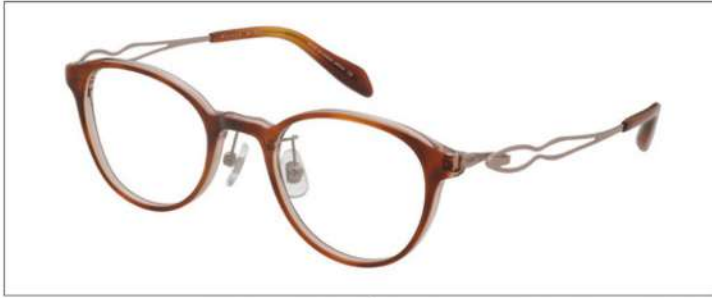
No.2 F:クリアブラウン/クリアピンク T:ライトピンク