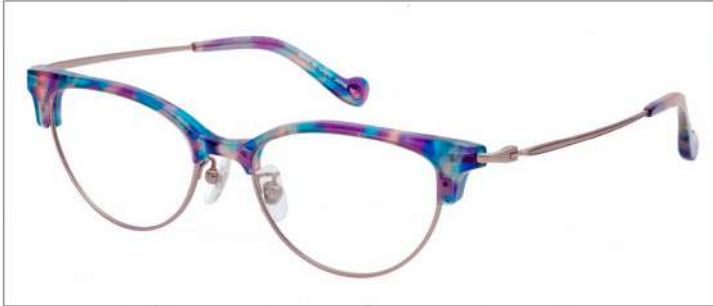
No.1 F:ピンクゴールド×アクアブルーパープルデミ T:ピンクゴールド

材質 F:アセテート×チタン T:βチタン 52□18-137 ↑36.5 00340