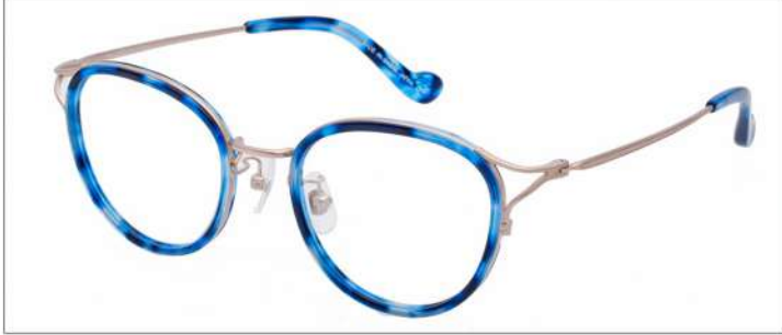
No.4 F:ゴールド×ブルーネイビーデミ T:ゴールド

材質 F:アセテート×チタン T:βチタン 49□20-137 ↑41.0 00340