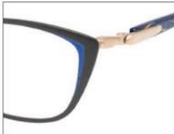
No.1 F:ブラック(ブルー) T:パールブルーブロック