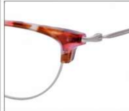
No.2 F:シルバー× ピンクブラウンデミ T:シルバー