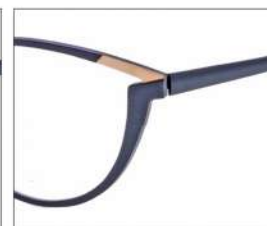
No.4 F:ブラック×ゴールド T:ブラック