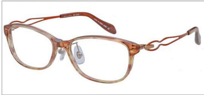
No.1 F:クリアベージュササ T:オレンジ

MX 5003 材質 F:アセテート T:βチタン パネ部:βチタン 52□15-137 ↓32.3 00330