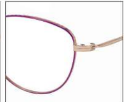
No.4 F:ゴールド× ラベンダーパープル T:ゴールド