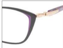
No.2 F:ブラック(パープル) T:パールパープルブロック