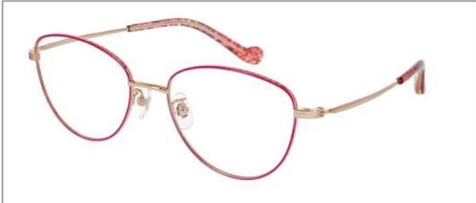
No.3 F:ゴールド×ラズベリーピンク T:ゴールド

MX 5026 材質F:チタン×七宝 T:βチタン 54□18-137 ¥43.1 00320