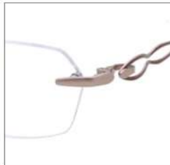
No.2 F:ピンク T:レッド