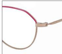
No.5 F:ゴールド× アザレアピンク T:ゴールド