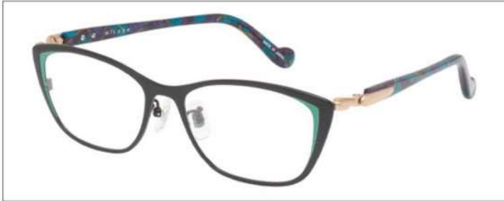
No.4 F:ブラック(グリーン) T:パールグリーンブロック

材質 F:チタン T:アセテート(バネ部:βチタン) 52□16-135 ↑36.0 00340