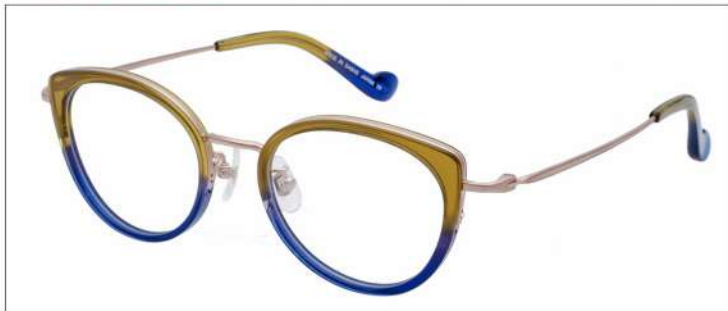
No.1 F:ゴールド×カーキ/ネイビーグラデ T:ゴールド

材質 F:アセテート×チタン T:βチタン 48□20-137 ↓39.5 00340