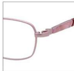
No.2 F:ピンク T:ピンクササ / レッドブロック