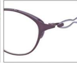
No.2 F:パープルマット/ ラベンダー T:ラベンダー