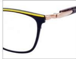
No.5 F:ブラック(イエロー) T:カーキブラウンラメ