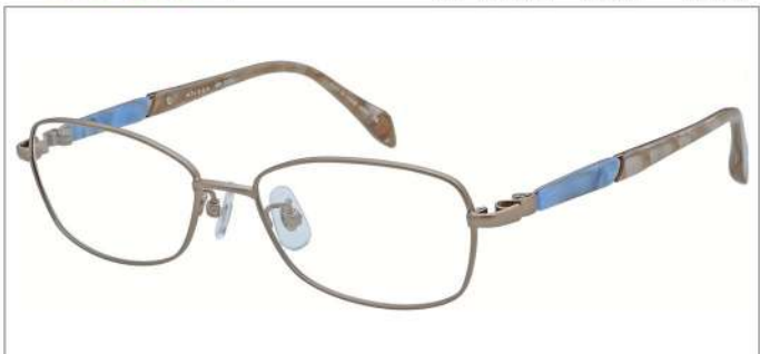
No.1 F:トパーズ T:ライトブルーササ / ベージュゴールドブロック

MX 5004 材質 F:チタン T:βチタン アセテート パネ部:βチタン 53□16-130 ↓34.0 00330