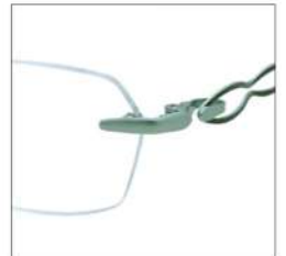
No.4 F:ライトグリーン T:カーキグリーン

MX 5003 材質 F:アセテート T:βチタン パネ部:βチタン 52□15-137 ↓32.3 00330