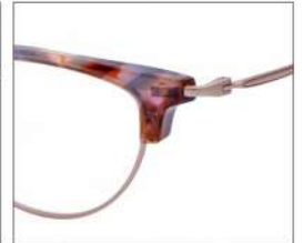
No.4 F:ピンクゴールド×ブラウン パープルデミ T:ピンクゴールド