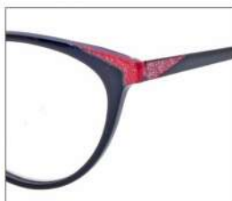
No.1 F:ブラック×レッドラメ T:ブラック