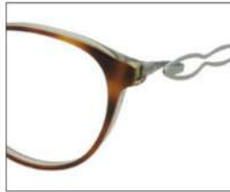
No.1 F:ブラウンデミ/ クリアグリーン T:ライトグリーン