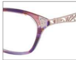
No.3 F:パープル ×ブラウンブロック T:パープル×ブラウンブロック (ピンクゴールド)