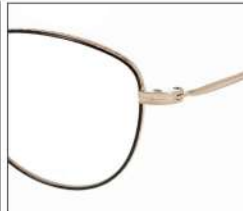
No.1 F:ゴールド×ブラック T:ゴールド