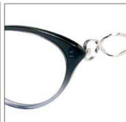
No.4 F:クリアグレーハーフ T:シルバー /クリアグレー