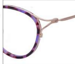
No.2 F:ゴールド×パープル ブラウンデミ T:ゴールド