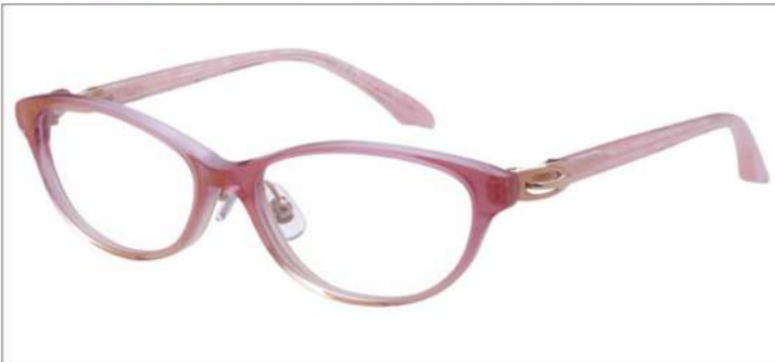
No.2 F:パールピンクハーフ T:ゴールド