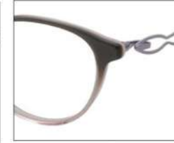
No.4 F:パールグレーハーフ ピンク T:ラベンダー