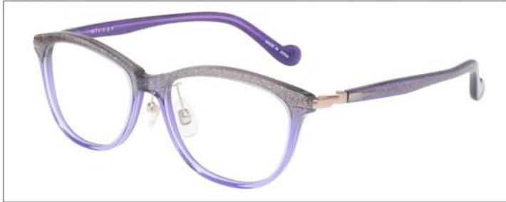
No.4 F:パープルラメグラデ T:パープルラメ

材質 F:アセテート T:アセテート(バネ部:βチタン) 52□16-135 ↑38.0 00320