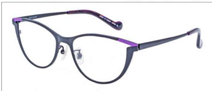
No.2 F:ブラック×ライトパープル T:ブラック