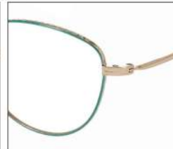
No.2 F:ゴールド× ピーコックグリーン T:ゴールド