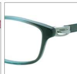
No.4 F:グレーグリーングラデ T:シルバー