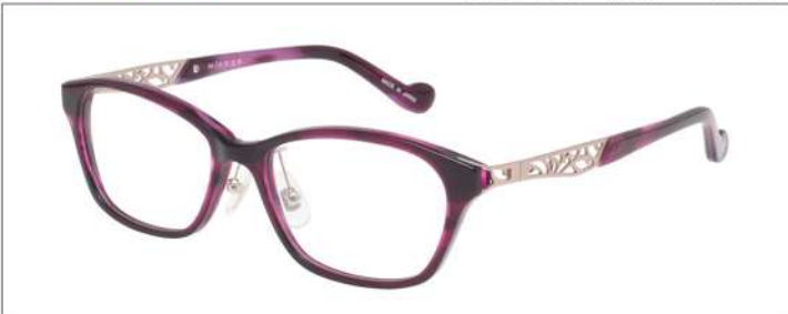
No.2 F:パープルササ T:パープルササ(ピンクゴールド)

材質 F:アセテート T:アセテート・βチタン 52□16-135 ↓35.0 00320