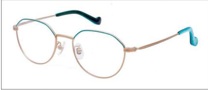
No.4 F:ゴールド×ピーコックブルー T:ゴールド

MX 5023 材質F:チタン×七宝 T:βチタン 51□18-137 ¥41.0 00320