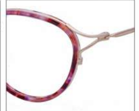
No.3 F:ゴールド×レッドパープル ブラウンデミ T:ゴールド