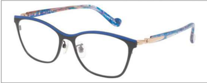
No.1 F:ブラック(ブルー) T:パープルxブルー

材質 F:チタン T:アセテート(バネ部:βチタン) 52□16-135 ↑37.0 00340