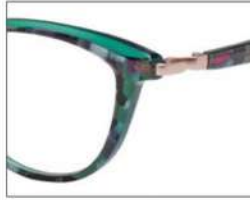
No.1 パープルブロック ×クリアダークグリーン