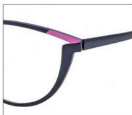
No.1 F:ブラック×ライトピンク T:ブラック