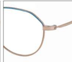
No.6 F:ゴールド× スカイブルー T:ゴールド