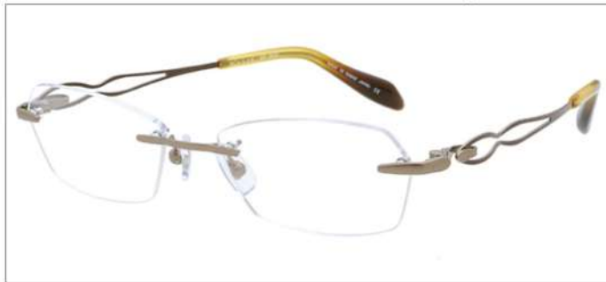
No.1 F:マロン T:ブラウン

MX 5002 材質 F:チタン T:βチタン パネ部:βチタン 52□17-134 ↓30.8 00320