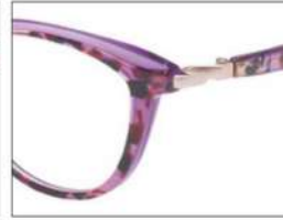
No.2 ブラウンブロック ×クリアパープル