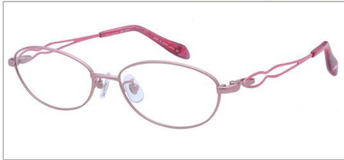
No.2 F:ピンク T:ピーチ

MX 5001 材質 F:チタン T:βチタン パネ部:βチタン 53□16-134 ↓32.0 00320