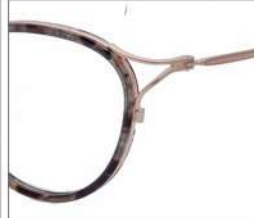
No.1 F:ゴールド× グレーブラウンデミ T:ゴールド