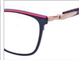
No.6 F:ブラック(ピンク) T:ワインパープルラメ