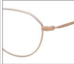
No.1 F:ゴールド×ホワイト T:ゴールド