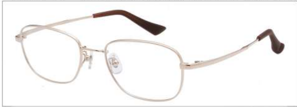
No.1 ホワイトゴールド

LX1110 材質 F:合金 B,T:形状記憶合金 52□19-140 ↓35.4 00210