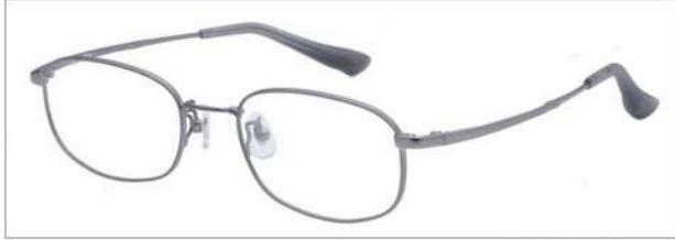
No.3 ライトグレーマット

LX1111 材質 F:合金 B,T:形状記憶合金 52□19-140 ↓33.5 00210