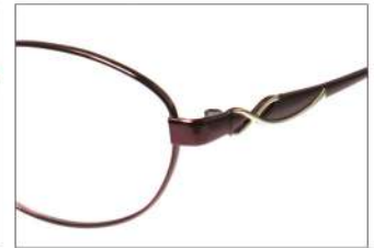
No.4 F:ワイン / ワイン