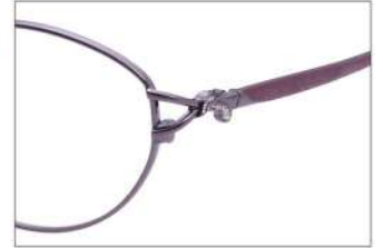
No.3 F: ワインパープル T: エンジマット(印刷)