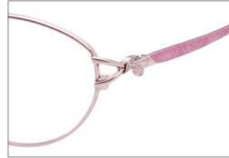
No.2 F: ピンク T: ピンクマット(印刷)