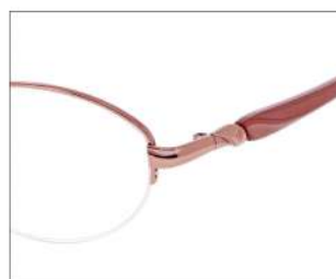
No.1 F: ピンクオレンジ T: パールピンクベージュ