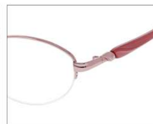
No.2 F: ピンク T: パールピンク

YK400 材質 F:チタン T:CP 51□17-135 ↓35.4 00230