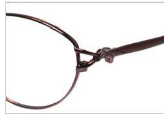
No.5 F: ワイン T: ワインマット(印刷)