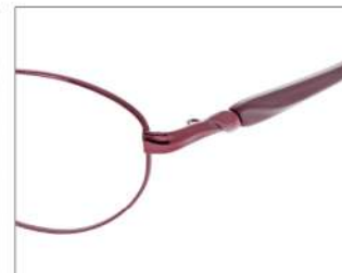
No.3 F: ワイン T: パールワイン

YK399 材質 F:チタン T:CP 51□17-135 ↓35.3 00230