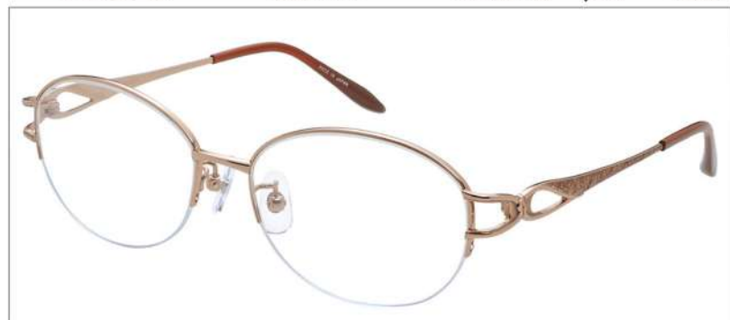
No.1 オレンジ / ライトブラウン