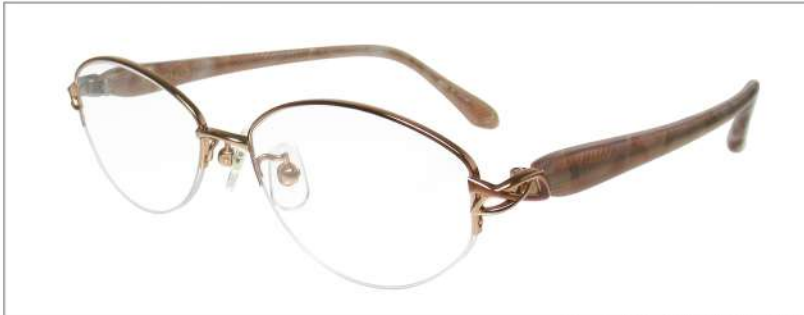
No.4 オレンジ / ブラウンササ