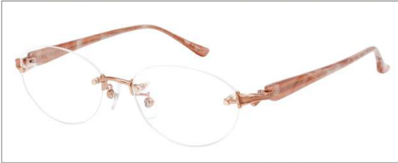
No.1 オレンジゴールド/ページュササ