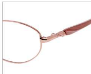
No.1 F: ピンクオレンジ T: パールピンクベージュ