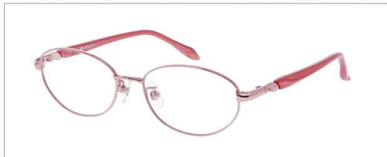
No.2 F: ピンク T: パールピンク

YK398 材質 F:チタン T:CP 52□16-135 ↓35.0 00230