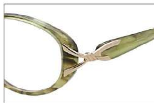
No.1 カーキグリーンササ