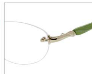
No.3 F: ライトゴールド T: パールライトグリーン