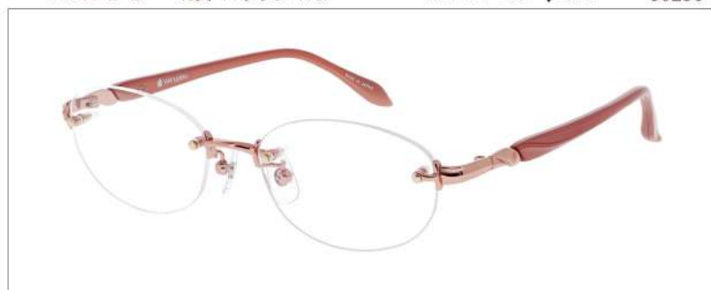
No.1 F: ピンクオレンジ T: パールピンクベージュ

YK400 材質 F:チタン T:CP 51□17-135 ↓35.4 00230