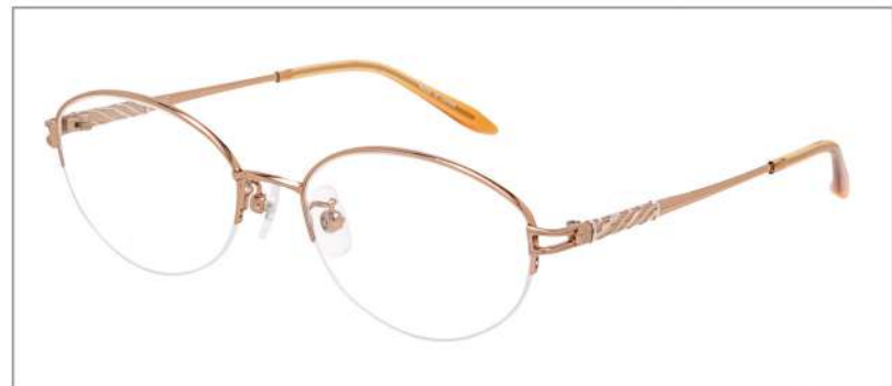
No.1 オレンジゴールド