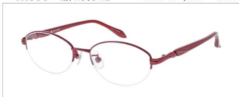
No.3 F: ローズ T: パールローズ

YK399 材質 F:チタン T:CP 51□17-135 ↓35.3 00230