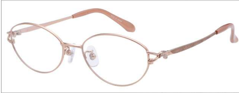
No.1 F: オレンジ T: ブラウンマット(印刷)