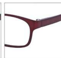
No.4 シャーリングワイン