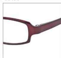
No.4 シャーリングワイン

AD 2044 材質 F:ウルテム T:ウルテム 52□17-140 ↓32.0 00150