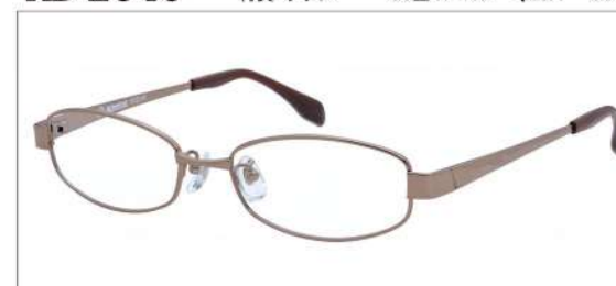
No.2 ブラウン(ライム/ブラック)