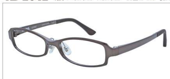
No.2 シャーリングブラウン

AD 2042 材質 F:ウルテム T:ウルテム 53□17-140 ↓27.2 00150