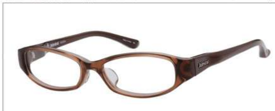
No.2 ブラウン/ダークブラウン

AD 2034 材質 F:アセテート T:TR90 51□15-138 ↓26.5