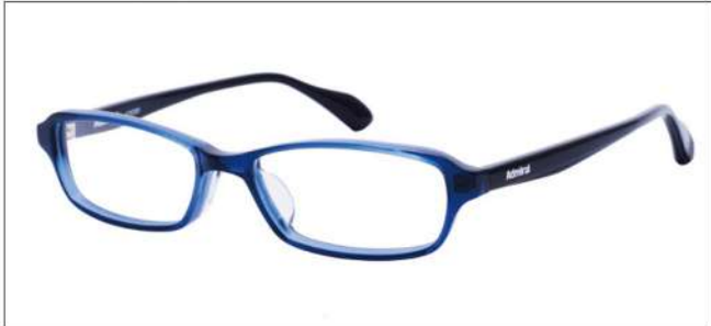
No.4 ネイビー/ブラック