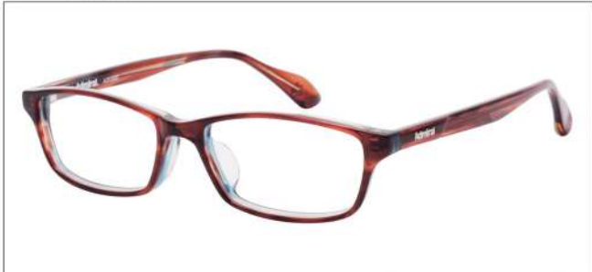
No.2 ブラウングリーンササ