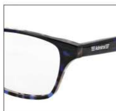
No.4 ブルーグレーデミ