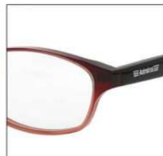
No.3 F:ダークワインハーフ T:ブラック