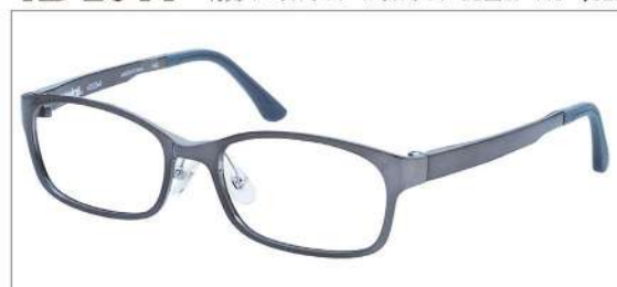
No.3 シャーリンググレー

AD 2044 材質 F:ウルテム T:ウルテム 52□17-140 ↓32.0 00150