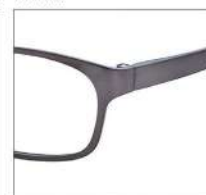
No.2 シャーリングブラウン