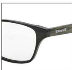
No.3 F:ブラック T:カーキ