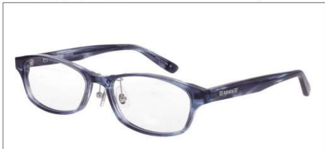
No.4 ブルーグレーササ