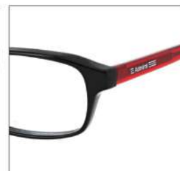
No.3 F:ブラック T:クリアレッド