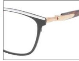
No.3 F:ブラック(ホワイト) T:ブラウン×グレー