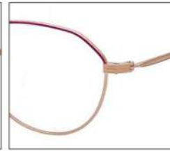
No.2 F:ゴールド× レッドパープル T:ゴールド