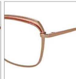
No.2 ゴールド /コーラルピンクラメ