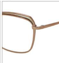
No.1 ゴールド/シルバーラメ