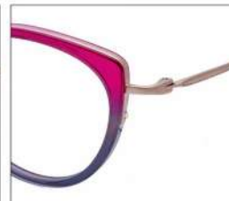
No.3 F:ゴールド×ピンク/ グレーグラデ T:ゴールド