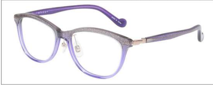
No.4 F:パープルラメグラデ T:パープルラメ