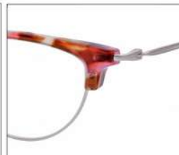
No.2 F:シルバー× ピンクブラウンデミ T:シルバー