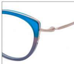
No.2 F:ゴールド×アクアブルー/ グレーグラデ T:ゴールド