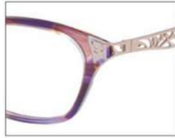
No.3 F:パープル ×ブラウンブロック T:パープル×ブラウンブロック (ピンクゴールド)