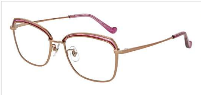
No.3 ゴールド/オーキッドラメ

MX5028 材質:チタン(ラメ七宝) 54□18-142 ↓40.0 00340