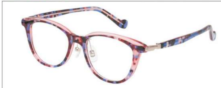
No.3 ブルーブロック×クリアピンク