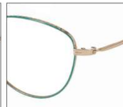
No.2 F:ゴールド× ピーコックグリーン T:ゴールド