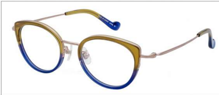
No.1 F:ゴールド×カーキ/ネイビーグラデ T:ゴールド

材質 F:アセテート×チタン T:βチタン 48□20-137 ↓39.5 00360