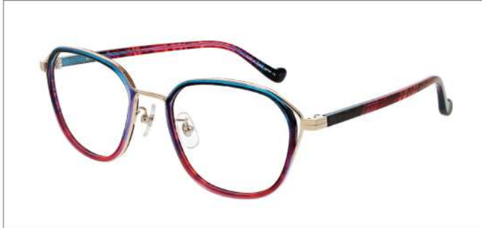
No.1 ブルー・パープルグラデ

MX5027 材質:アセテート/チタン 53□20-142 ↓42.0 00360