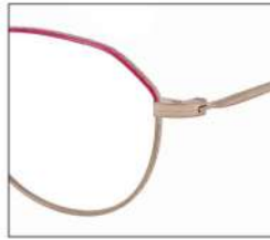
No.5 F:ゴールド× アザレアピンク T:ゴールド