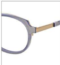
No.1 ベリーベリーパール