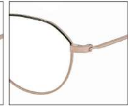
No.7 F:ゴールド×ブラック T:ゴールド