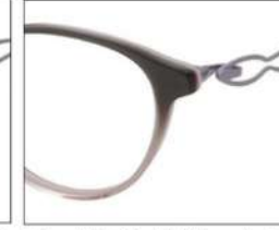
No.4 F:パールグレーハーフ ピンク T:ラベンダー