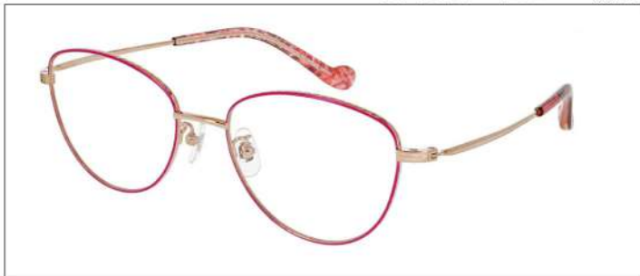
No.3 F:ゴールド×ラズベリーピンク T:ゴールド