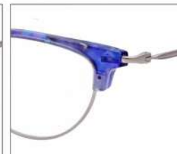
No.3 F:シルバー×ライトブルー パープルデミ T:シルバー