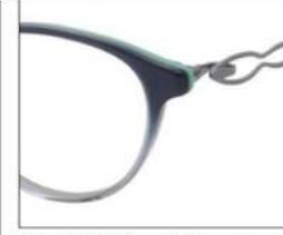
No.3 F:パールブルーハーフ ミントグリーン T:ライトブルー