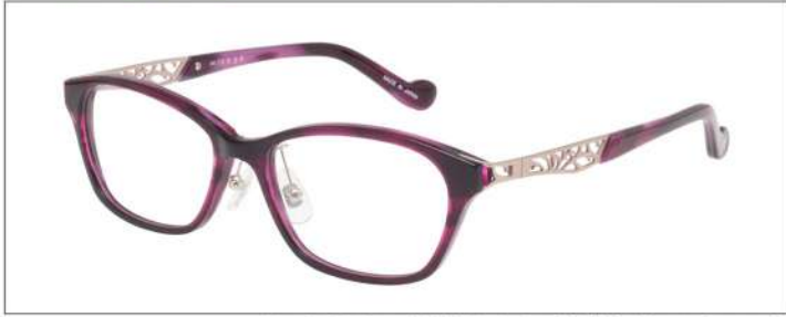
No.2 F:パープルササ T:パープルササ(ピンクゴールド)

材質 F:アセテート T:アセテート・βチタン 52□16-135 ↓35.0 00340