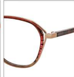
No.3 ブラウン・グレイグラデ