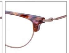
No.4 F:ピンクゴールド×ブラウン パープルデミ T:ピンクゴールド