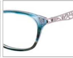
No.5 F:グリーンブラウンデミ (ピンクゴールド)