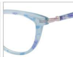
No.6 F:アクアブルーラメ