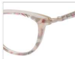
No.5 F:オフホワイトラメ