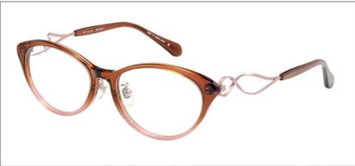
No.2 F:クリアブラウンピンクハーフ T:ピンク/クリアブラウン