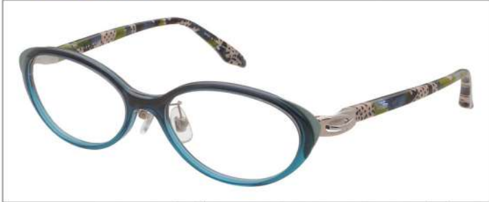
No.1 F:アクアグラデ/ ミントグリーン T:アクア、ベージュブロック