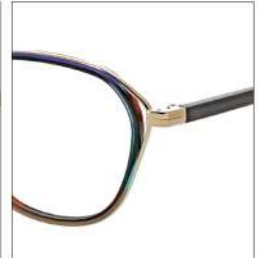
No.4 ダークブルー・ カーキグラデ

MX5028 材質:チタン(ラメ七宝) 54□18-142 ↓40.0 00340