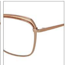
No.4 ゴールド/ゴールドラメ

MX5029 材質:アセテート/チタン 50□21-143 ↓38.0 00360