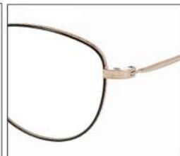
No.1 F:ゴールド×ブラック T:ゴールド