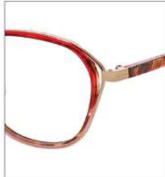
No.2 レッド・ピンクグラデ