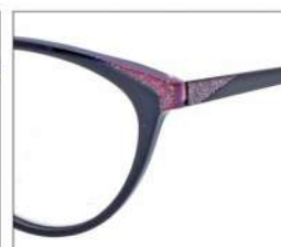
No.2 F:ブラック× レッドパープルラメ T:ブラック