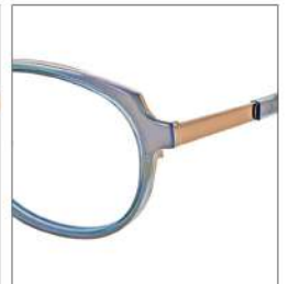
No.4 グリーニッシュパール