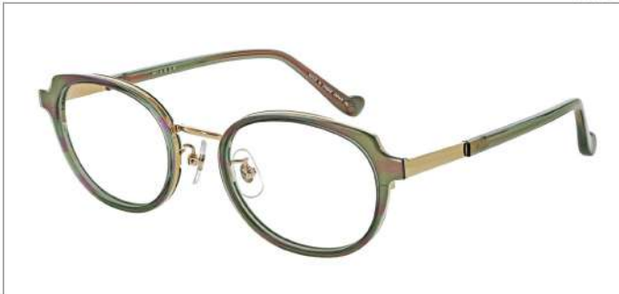
No.3 カーキメタリックパープル

MX5029 材質:アセテート/チタン 50□21-143 ↓38.0 00360