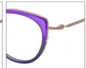
No.4 F:ゴールド×パープル/ グレーグラデ T:ゴールド