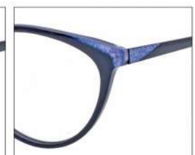
No.4 F:ブラック× ブルーパープルラメ T:ブラック