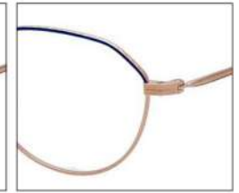
No.3 F:ゴールド×ネイビー T:ゴールド