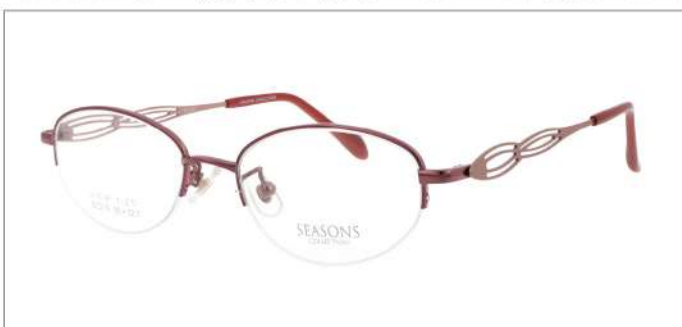
No.3 F:ワイン T:ピンクオレンジ