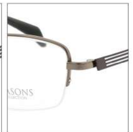
No.4 F:ライトブラウン T:ブラウン