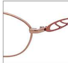
No.1 オレンジ / メーブルオレンジ