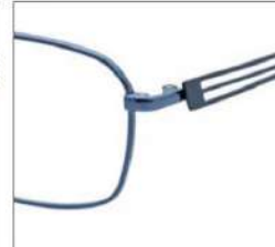
No.4 ブルーグレー / ブラック