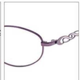
No.4 F:パープル T:パールアイリス