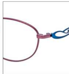
No.3 F:ワインレッド T:ティールブルー