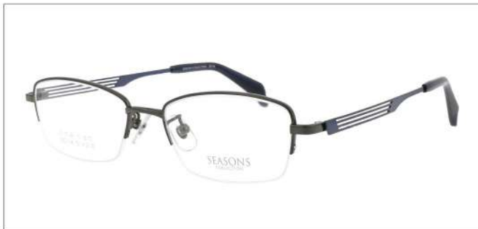
No.1 F:グレー T:ホリゾンブルー