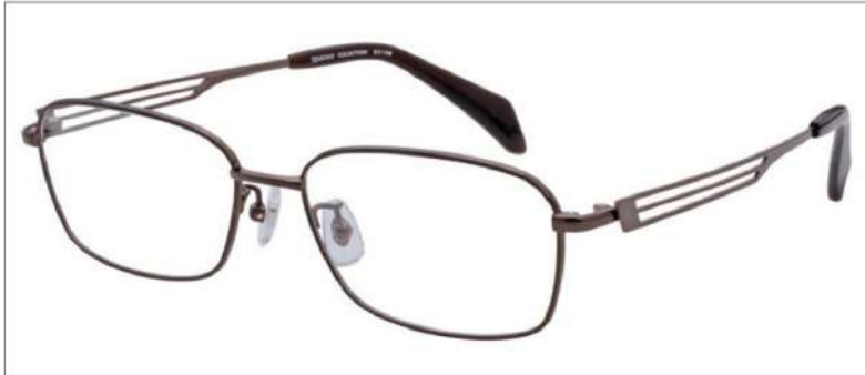
No.2 ブラウン / ライトブラウン