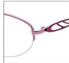
No.2 ローズピンク / パッションパープル