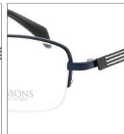
No.3 F:ネイビー T:ブラックマット