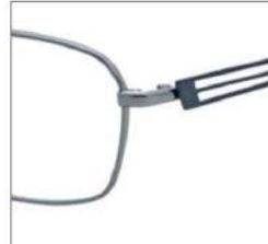
No.1 ライトグレー / サイレントブルー