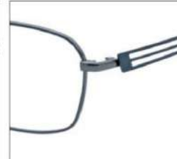
No.3 ガンメタル / ダークグリーン