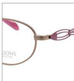
No.1 F:オレンジ T:ラズベリー