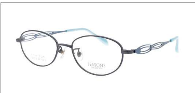
No.4 F:ネイビー T:スカイブルー