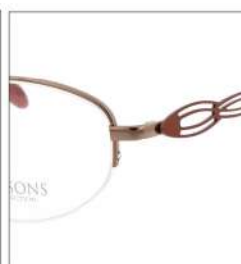
No.1 F:オレンジ T:キャロットオレンジ