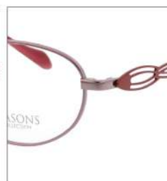
No.2 F:ローズピンク T:ミラノレッド