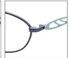
No.4 ネイビー / エメラルドグリーン