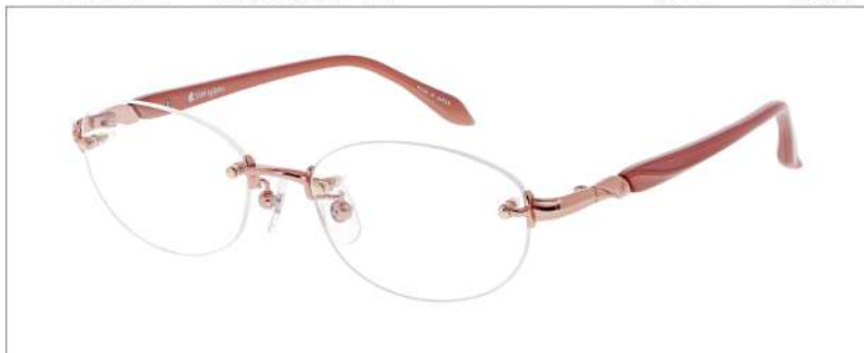
No.1 F: ピンクオレンジ T: パールピンクベージュ

YK400 材質 F:チタン T:CP 51□17-135 ↓35.4 00250