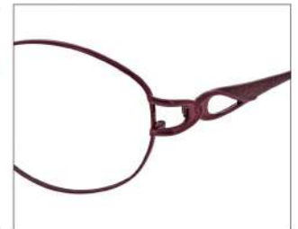
No.3 F: ワイン T: ワイン