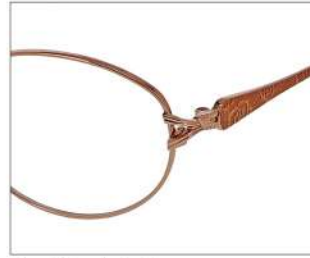
No.1 F: オレンジ T: オレンジ/オレンジゴールド