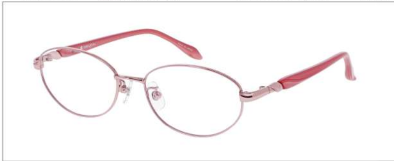
No.2 F: ピンク T: パールピンク

YK398 材質 F:チタン T:CP 52□16-135 ↓35.0 00250