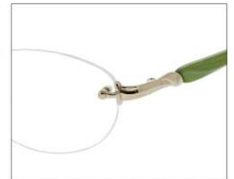
No.3 F: ライトゴールド T: パールライトグリーン