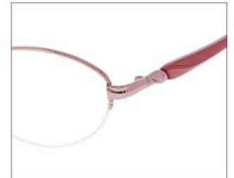
No.2 F: ピンク T: パールピンク

YK400 材質 F:チタン T:CP 51□17-135 ↓35.4 00250