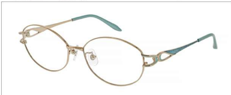
No.1 F: ゴールド T: ゴールド/グレイッシュユミント