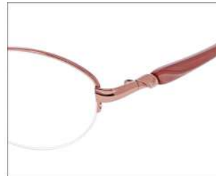
No.1 F: ピンクオレンジ T: パールピンクベージュ