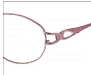
No.2 F: ピンク T: ピンク