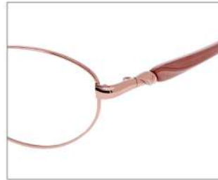
No.1 F: ピンクオレンジ T: パールピンクベージュ