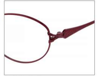
No.3 F: ローズ T: ローズ/チェリーレッド