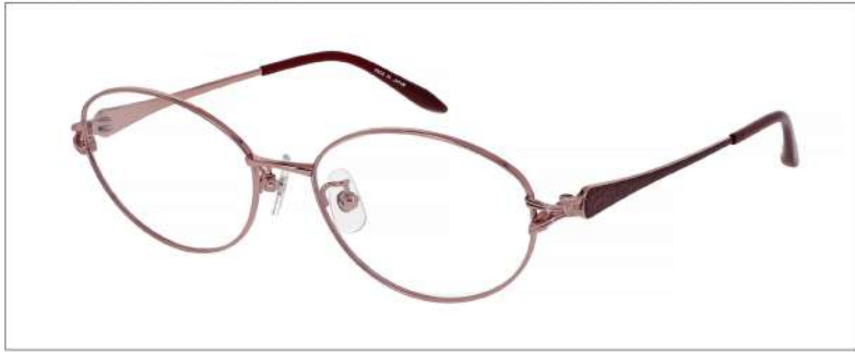
No.2 F: ピンク T: ピンク/ワイン