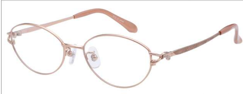
No.1 F: オレンジ T: ブラウンマット(印刷)