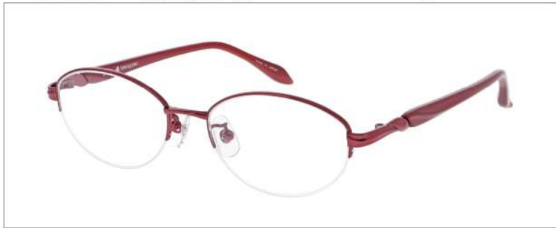
No.3 F: ローズ T: パールローズ

YK399 材質 F:チタン T:CP 51□17-135 ↓35.3 00250