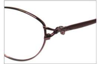
No.5 F: ワイン T: ワインマット(印刷)

YK346 材質:F:チタン T:アセテート 53□17-135 35.0 ↓ 00240