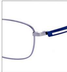
No.1 F:ライトグレー T:ネイビー