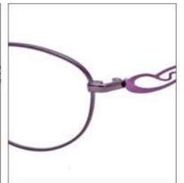
No.4 F:パープル T:アヤメ