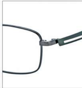
No.1 F:グレー T:カーキ