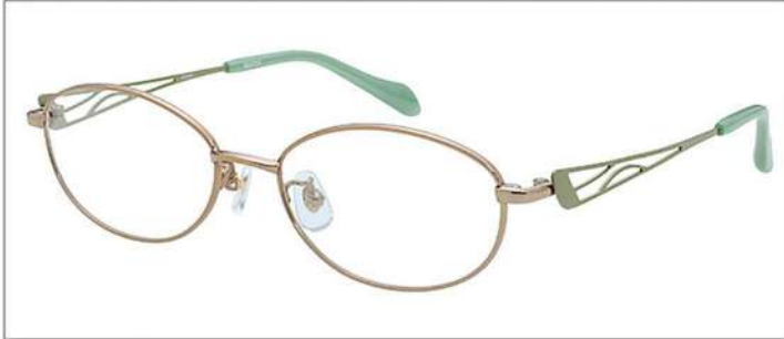
No.1 オレンジ / オリーブ

SC201 材質 F:チタン T:βチタン 52□16-135 33.0↑ 00170