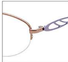
No.1 オレンジ / ライトバイオレット