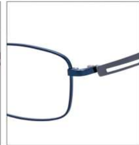
No.4 F:ネイビー T:グレー

SC 112 材質:チタン/βチタン 56□16-145 ↓36.0 00170