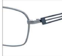
No.1 ライトグレー / サイレントブルー