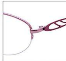
No.2 ローズピンク / パッションパープル