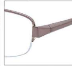
No.2 シャーリング ライトブラウン