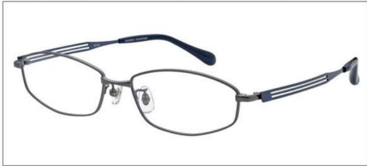
No.1 F:ライトグレーマット T:ホリゾンブルー

SC 109 材質:F:チタン T:βチタン 55□16-145 ↓29.0 00170