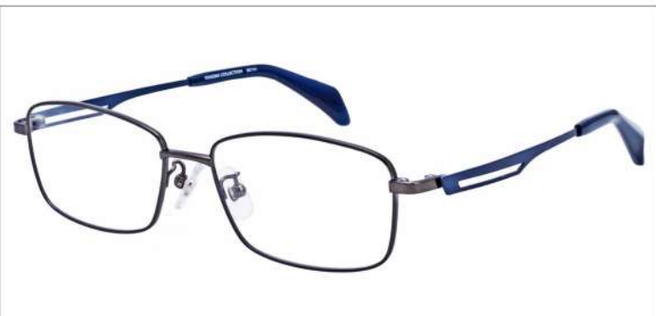
No.3 F:ガンメタル T:ネイビー

SC 111 材質:チタン/βチタン 54□16-145 ↓35.0 00170