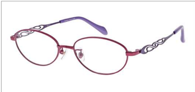
No.3 F:ワインレッド T:ロイヤルパープル