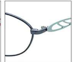
No.4 ネイビー / エメラルドグリーン