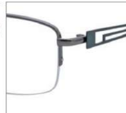
No.3 グレー / モスグリーン