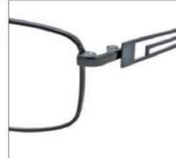
No.4 ダークグリーン / グレー

SC108 材質 F:チタン T:βチタン 53□17-145 32.0↑ 00170