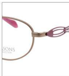
No.1 F:オレンジ T:ラズベリー