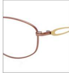
No.1 F:オレンジ T:レモンイエロー