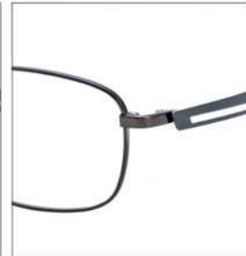
No.3 F:ガンメタル T:カーキ