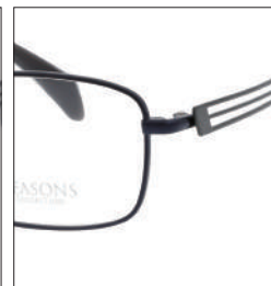
No.4 F:ネイビー T:グレー