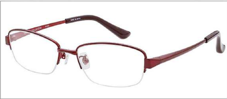
No.4 シャーリングワイン