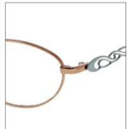
No.4 F:オレンジ T:ミントグリーン