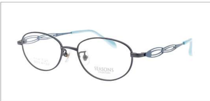
No.4 F:ネイビー T:スカイブルー