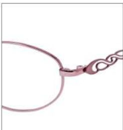
No.2 F:ピンク T:ミスティック