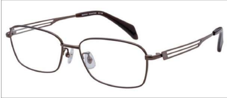
No.2 ブラウン / ライトブラウン

SC106 材質 F:チタン T:βチタン 55□16-145 34.0↑ 00170