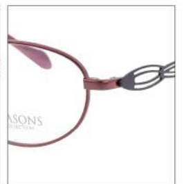
No.3 F:ワイン T:エドパープル