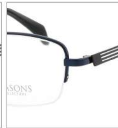
No.3 F:ネイビー T:ブラックマット