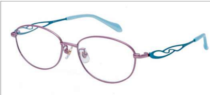
No.2 F:ローズピンク T:ティファニーブルー

SC212 材質 F:チタン T:βチタン 52□16-135 ↓36.0 00170