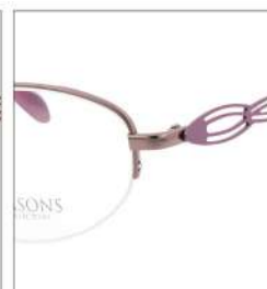
No.2 F:ピンク T:オーキッド