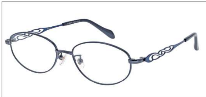
No.1 F:ネイビー T:アントワープブルー