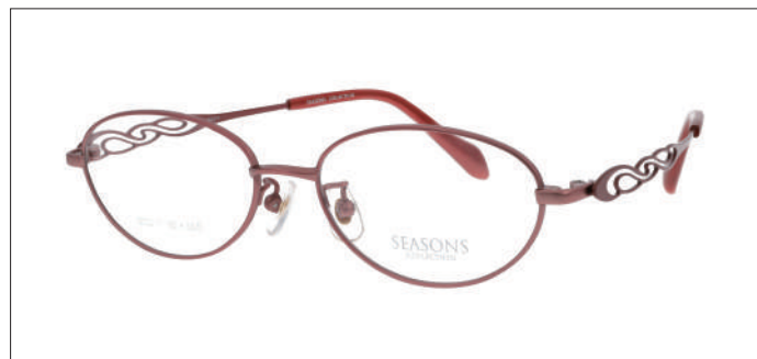
No.3 F:ローズピンクマット T:トマトレッド