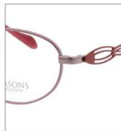
No.2 F:ローズピンク T:ミラノレッド