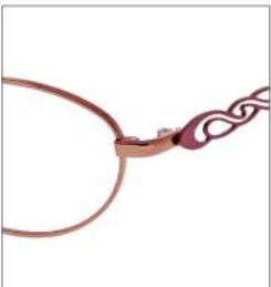
No.1 F:オレンジ T:パートンオレンジ