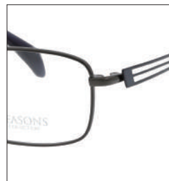
No.3 F:ガンメタル T:ネイビー