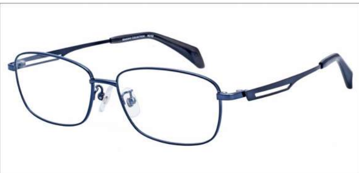
No.4 F:ブルーグレー T:ダークグレー

SC 112 材質:チタン/βチタン 56□16-145 ↓36.0 00170