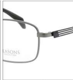
No.1 F:ライトグレー T:ダークグレー