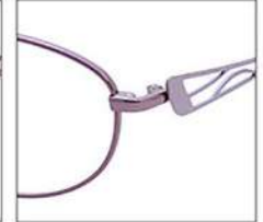
No.4 パープル / シルバーパープル

SC203 材質 F:チタン T:βチタン 51□16-135 32.0↑ 00170