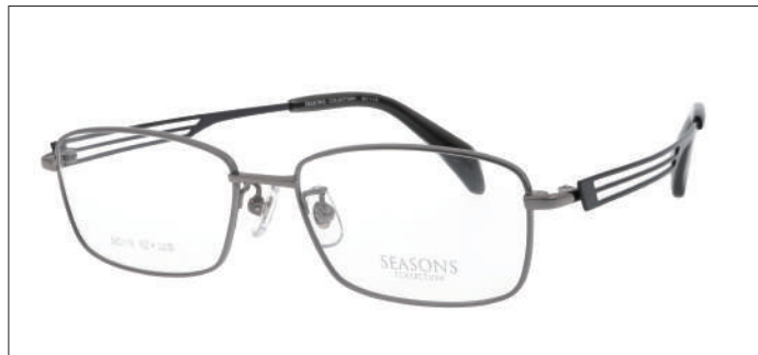
No.1 F:ライトグレー T:ダークグレー