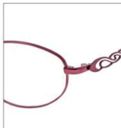
No.3 F:ワイン T:カーディナルレッド