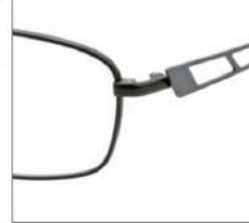
No.4 カーキマット / グレーマット

SC106 材質 F:チタン T:βチタン 55□16-145 34.0↑ 00170