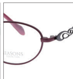
No.2 F:ラズベリーマット T:ディープ ロイヤルパープル