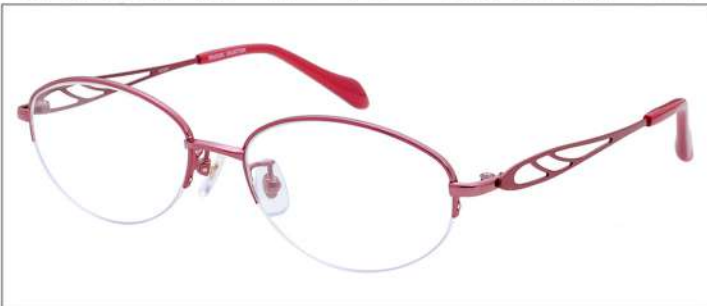
No.3 ワイン / レッド

SC204 材質 F:チタン T:βチタン 52□17-135 34.0↑ 00170