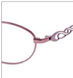
No.2 F:ピンク T:オーロラピンク