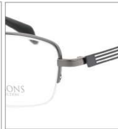
No.2 F:ライトグレー T:グレー