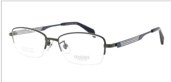
No.1 F:グレー T:ホリゾンブルー