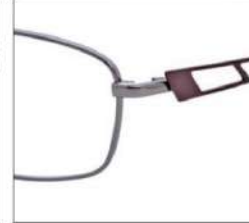
No.3 グレー / ダークワイン