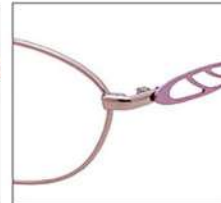
No.2 ピンク / チェリーピンク