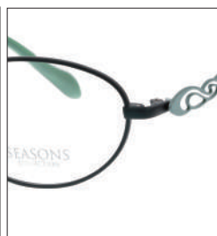
No.1 F:パイングリーンマット T:ウォーターグリーン