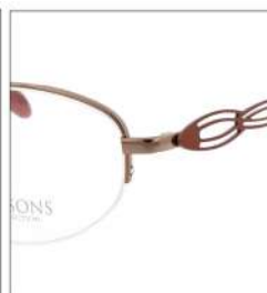
No.1 F:オレンジ T:キャロットオレンジ