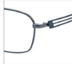
No.3 ガンメタル / ダークグリーン