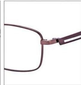
No.2 F:ライトブラウン T:ブラウン