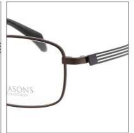
No.4 F:ダークブラウン T:パープル