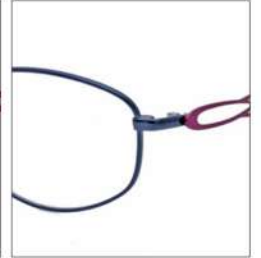
No.4 F:ネイビー T:チリアンパープル

SC212 材質 F:チタン T:βチタン 52□16-135 ↓36.0 00170