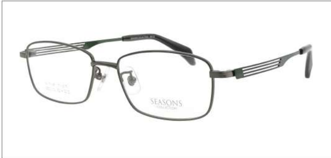
No.2 F:ガンメタル T:アイビーグリーン