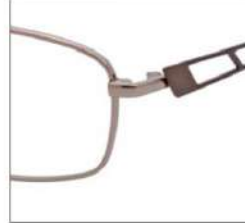
No.2 オレンジブラウン / ブラウン