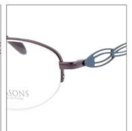
No.4 F:パープル T:スカイブルー