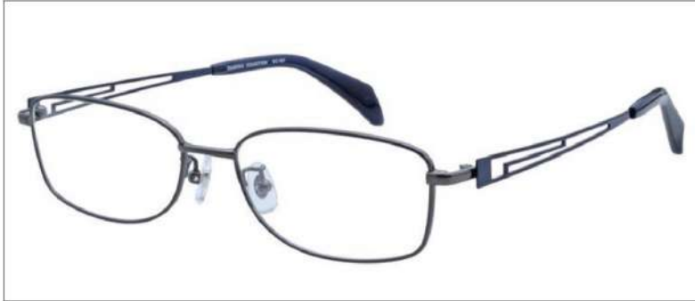
No.3 ガンメタル / ネイビー

SC107 材質 F:チタン T:βチタン 54□16-145 30.5↑ 00170