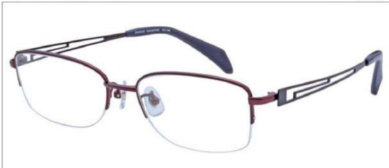
No.4 ダークワイン / ガンメタル

SC108 材質 F:チタン T:βチタン 53□17-145 32.0↑ 00170