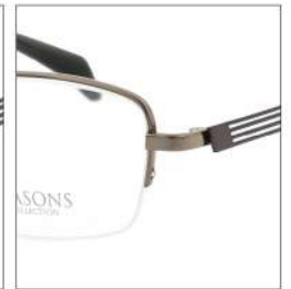
No.4 F:ライトブラウン T:ブラウン