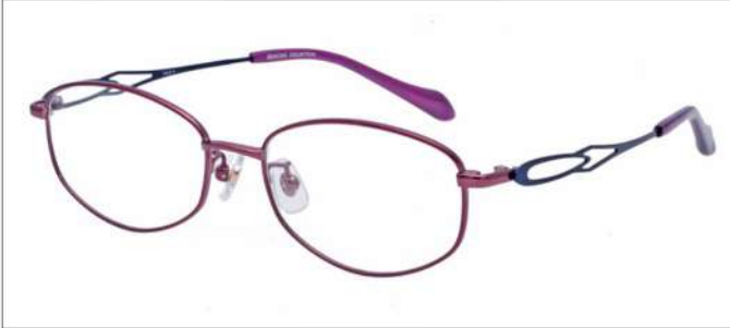
No.3 F:ワイン T:エナメルブルー

SC211 材質 F:チタン T:βチタン 51□16-135 ↓34.0 00170