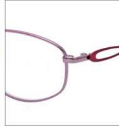
No.2 F:ローズピンク T:ワインレッド