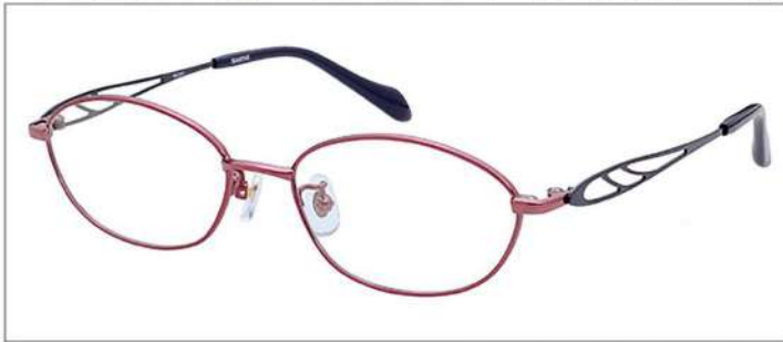
No.3 ワインレッド / サイレンスブルー

SC203 材質 F:チタン T:βチタン 51□16-135 32.0↑ 00170