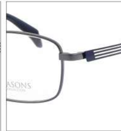
No.3 F:ブルーグレー T:オリエンタルブルー