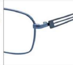
No.4 ブルーグレー / ブラック

SC107 材質 F:チタン T:βチタン 54□16-145 30.5↑ 00170