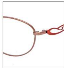
No.1 F:オレンジ T:キャロットオレンジ