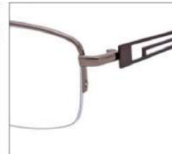
No.2 ライトブラウン / ダークブラウン