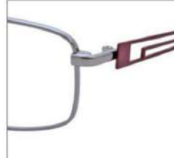
No.1 ライトグレー / ボルドー