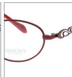
No.4 F:ワインマット T:ターキーレッド