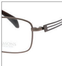
No.2 F:ライトブラウン T:ブラウン