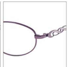
No.4 F:パープル T:パールアイリス