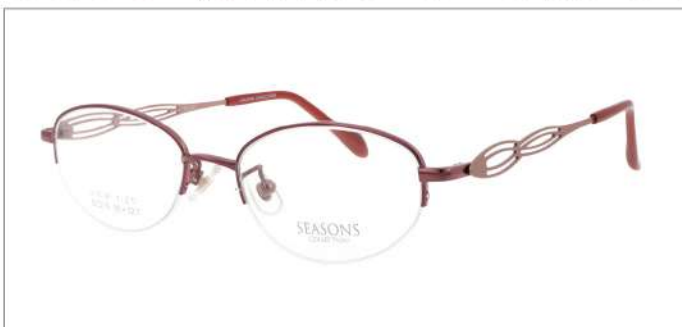
No.3 F:ワイン T:ピンクオレンジ