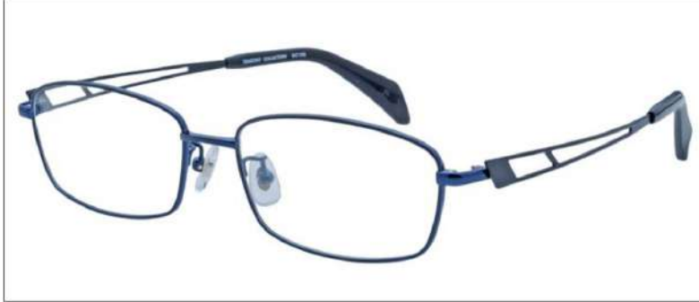
No.1 ネイビー / ブラックマット

SC105 材質 F:チタン T:βチタン 56□16-145 32.0↑ 00170