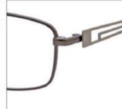
No.2 ブラウン / ブロンズマット