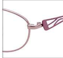
No.2 ピンク / パープル